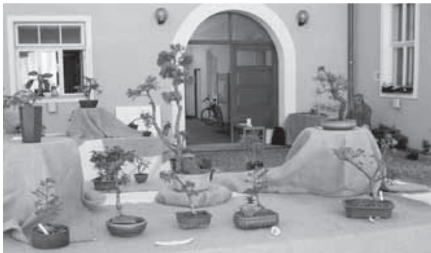
Z loňské výstavy.