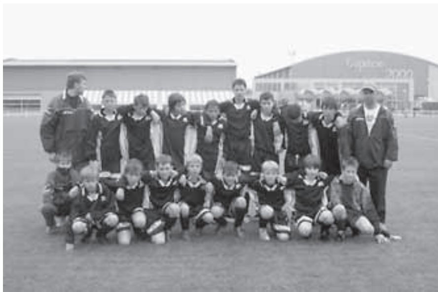
Mladší žáci, sezona 2004/2005.