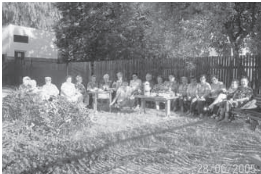
Obyvatelé domu s pečovatelskou službou při posezení u táboráku.