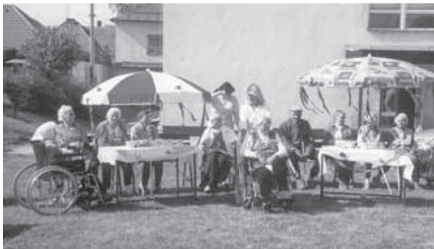
Obyvatelé domova důchodců.