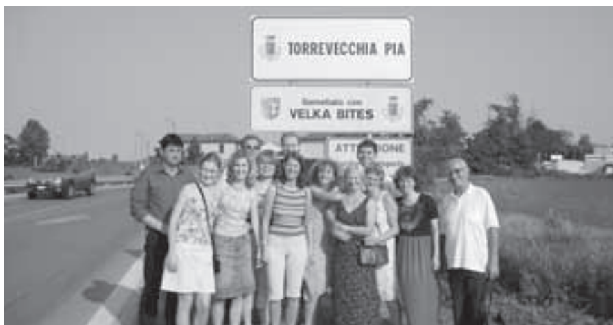
Míle nás překvapila tabule s názvy a znaky obou spřátelených měst

obyvatel, světoznámý milánský dóm pro 40 000 osob, s 2245 mramorovými sochami se zlatou Madonou na střeše, se 135 věžičkami, divadlo Scala, hrad Sforzesco a další. Italové byli a dodnes jsou dobří stavitelé, hodně toho v minulosti postavili i u nás.