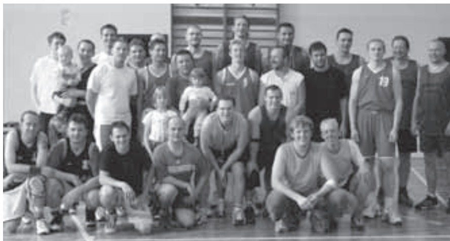
Účastníci II. ročníku Memoriálu Slávy Pecky.