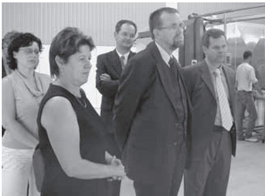
Zleva: náměstkyně ministra Jourová, místostarostka Žďáru nad Sázavou Zvěřinová, ministr Martínek a poslanec Parlamentu ČR Černý.

Následně se seznámil s průmyslovou zónou města a v ní nově otevřenou firmou Ebster, jejímž vlastníkem je italská společnost Bioster. Po úspěšně rozvíjející se společnosti Building Plastics se jedná o druhou firmu, která zahájila od července zkušební provoz, týkající se především sterilizaci zdravotnických prostředků.