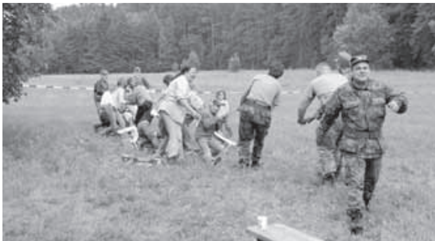
Děti zvítězily na celé čáře.