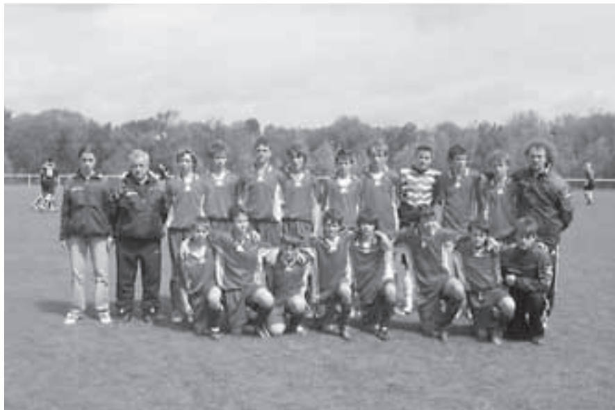
Starší žáci, sezona 2004/2005.

Konečné druhé místo ve skupině jim zaručovalo nedělní finále na překrásném hřišti v Senci. Starší žáci se pak museli připravovat na ranní utkání o sedmé místo v turnaji, které nakonec zvládli a po vítězství 1 : 0 obsadili konečnou 7. příčku. Mladší dorostenci se ve finále utkali s Doubravkou a od začátku čelili velkému tlaku. Ale dokázali skórovat, ovšem gólovou radost zhatil pomezní rozhodčí, jenž odmával hodně sporný ofsajd. Ve druhém poločase nebyl obrázek hry jiný a Doubravka, účastník druhé slovenské ligy, naše hráče dostala pod tlak. Z ojedinělého brejku naši hoši