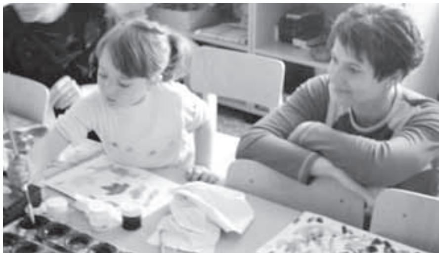
Děti v Baby clubu nejvíc baví malování barvami.