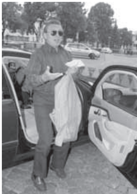
Pan Karel Gott přijíždí na náměstí do Velké Bíteše.

V malém modrém salonku pak Karel Gott. Nechala jsem si od něj podepsat list pro bítešskou kroniku a pro čtenáře Zpravodaje.