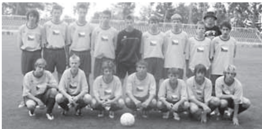
Mladší dorost, sezona 2004/2005.