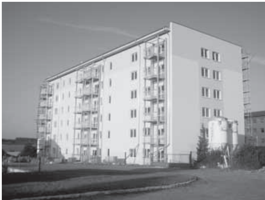
Bytový dům v novém kabátě.