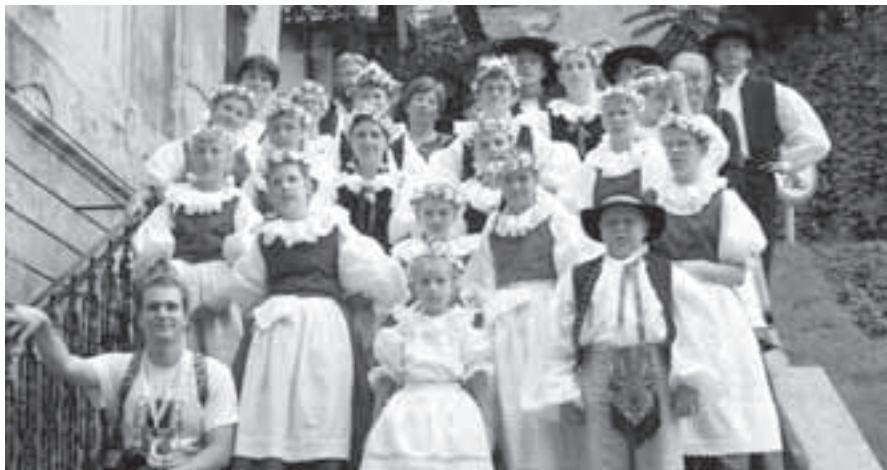
Na procházce městem před pátečním vystoupením.