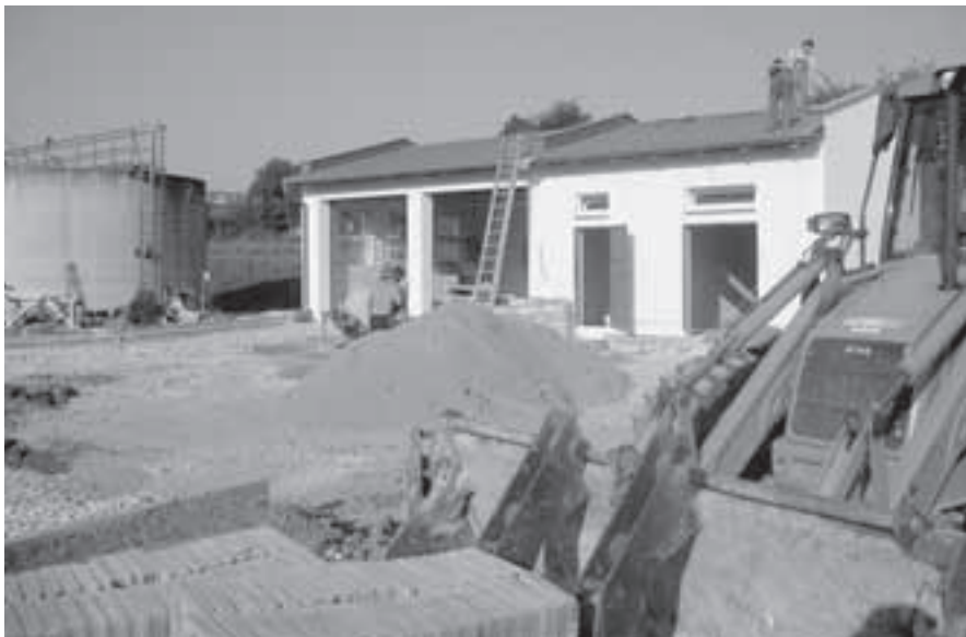
Stavba technického zázemí v závěrečné etapě dokončování.