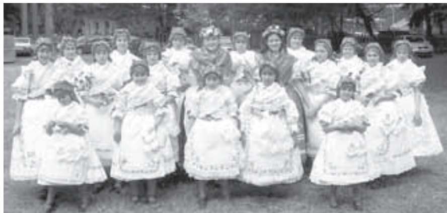
Královničky z Troubska.