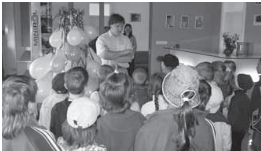
Návštěva ve firmě Building Plastics.

Pouhé dívání zvědavým dětem nestačí - to pánové z BDS tušili a pro děti připravili dvě projížďky. Ta první vedla po bitešských ulicích a náměstí úplně novým autobusem, který byl ještě „zabalený v igelitu“. Tuto vyjížďku zpestřily děti panu řidiči recitací: „V přeplněném autobusu, vezla tetka na trh husu...“ Druhá jízda proběhla