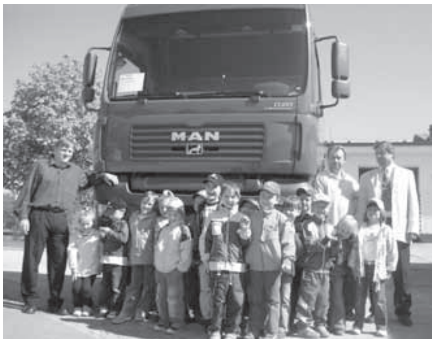
Děti v areálu Bítešské dopravní společnosti.