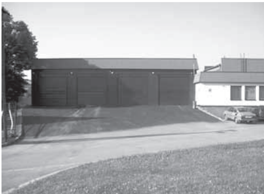
Pohled na novou výjezdovou plochu z garáží stanice HZS ve Velké Bíteši.

Výjezdy ze čtyř garáží stanice Hasičského záchranného sboru neodpovídaly technickým parametrům, a proto poslední týden v červnu provedla firma COLAS položení dvou vrstev asfaltového povrchu v rozsahu přes 300 m 2 , nákladem přes 100 000 korun. V letošním roce by měla proběhnout na středisku ještě jedna investice, a to přímo v rámci HZS má být zbudována v zadní části stanice mycí linka na vozidla sboru. V rámci schváleného státního rozpočtu roku 2005 byly vyčleněny na novou linku 2 milióny korun a HZS má nejvyšší čas zahájit veškeré práce, aby akce byla do konce roku úspěšně zrealizována.