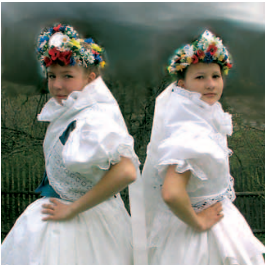
Národopisný soubor Bítešan.