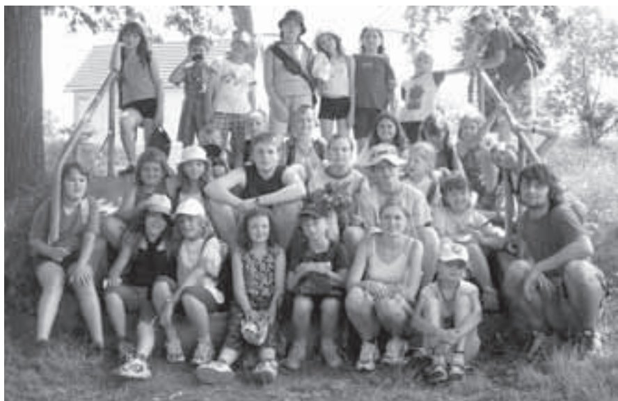
Společné foto všech táborníků.