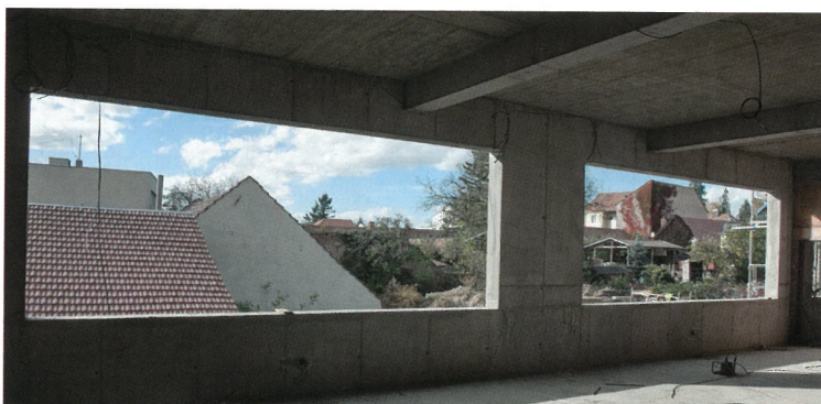
ODPOLEDNE BUDE V NOVÝCH TRÍDÁCH HODNĚ SLUNÍČKA.

Až budu fotit příště, určitě už bude stavba zakrytá.