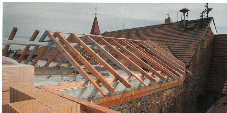
TESAŘI SE ČINÍ.

Pohled z přístavby na původní budovu školky