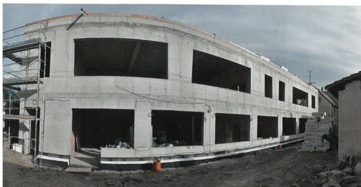
PŘÍSTAVBA ŠKOLKY ZE STRANY Č.P. 85. Panoramatické fotky mám moc rád. Občas trochu zkreslují, ale jen maličko. ☺

Okna v přístavené části směřují na západ.