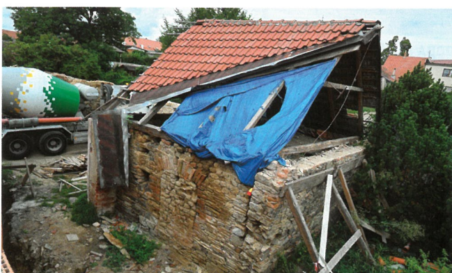
PAMÁTKÁŘI CENĚNÁ STODOLA

Nahoře bude jídelna a kuchyně, dole šatny.