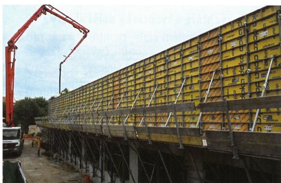
ROZŠÍŘENÍ DO DVORA ČP. 85

Železo a beton – zatím je vidět jen bednění.