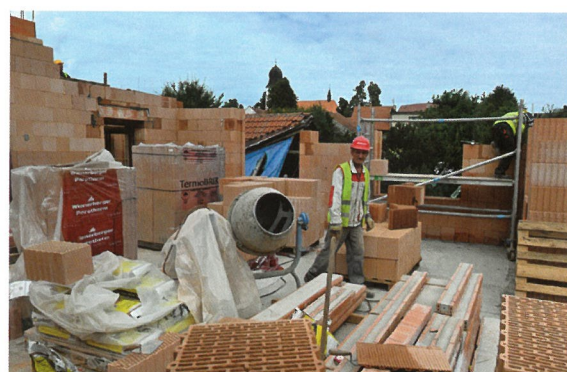
ODSUD BUDE KRÁSNÝ VÝHLED NA KOSTEL.

V původním stavu prý silně připomínal ementál.