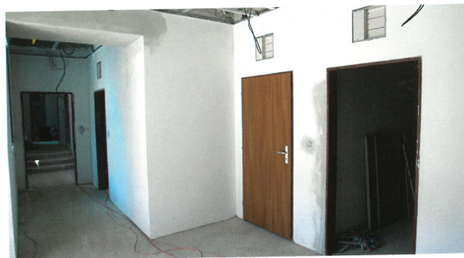
■ UŽ TO PŘIPOMÍNÁ VÍC ŠKOLKU, NEŽ STAVENIŠTĚ. Omítky schnou, ale pomalu.