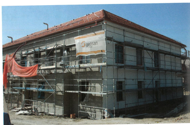
■ MÉNĚ PLACHET, VÍCE FASÁDY. Střecha už je kompletní

Z vnitřních prací začala montáž vnitřních skladeb střechy – zateplení a jeho překrytí, byla finalizována montáž silnoproudu a slaboproudu, pokračují práce na obkladech a dlažbách.