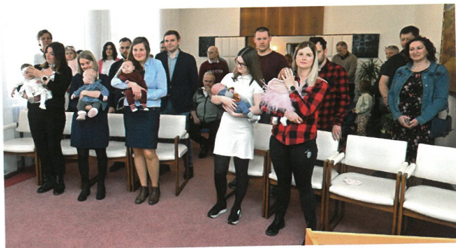
■ PŘIVÍTÁNO 16 DĚTÍ. Rosíte do lepších časů!

Na radnici bylo pozváno 32 nových občánků. Bohužel se kvůli vysoké marodce sešla jen polovina. Nejmladší Bítešáčky přivítal starosta i zástupci sboru pro občanské záležitosti, o milou kulturu se postaraly děti z mateřské i základní školy.