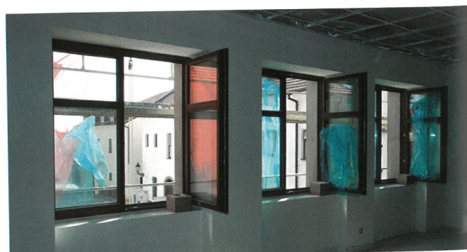
■ VĚTRÁME, KDYŽ JE VENKU PĚKNĚ. Výhled na radnici