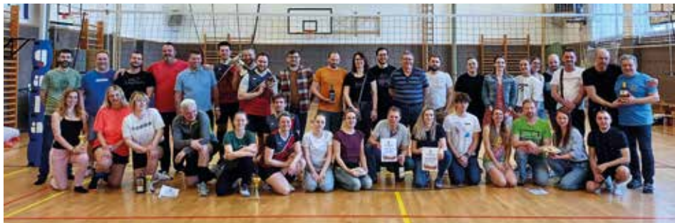
Společné foto. | Foto: Archiv TJ Spartak