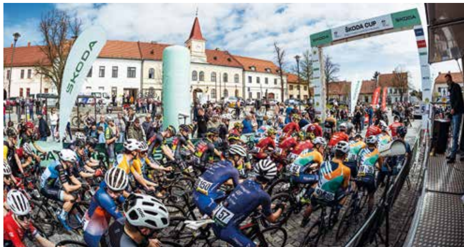
Start závodu na Masarykově náměstí.