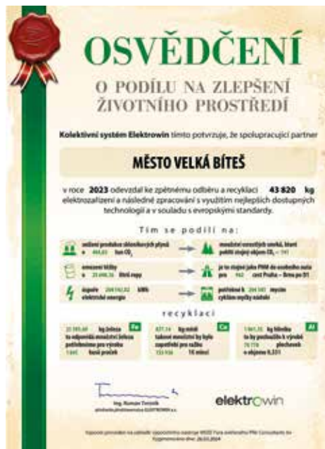
Osvědčení pro město Velkou Bíteš.

Pamatujte! Elektrozařízení obsahuje nejen dále využitelné materiály, ale také škodlivé látky. Odhozením do popelnice se elektrozařízení nedostanou k recyklaci, ale skončí nevyužitě na skládce. Odevzdávejte spotřebiče na sběrný dvůr, nebo poslednímu prodejci při zakoupení nového!