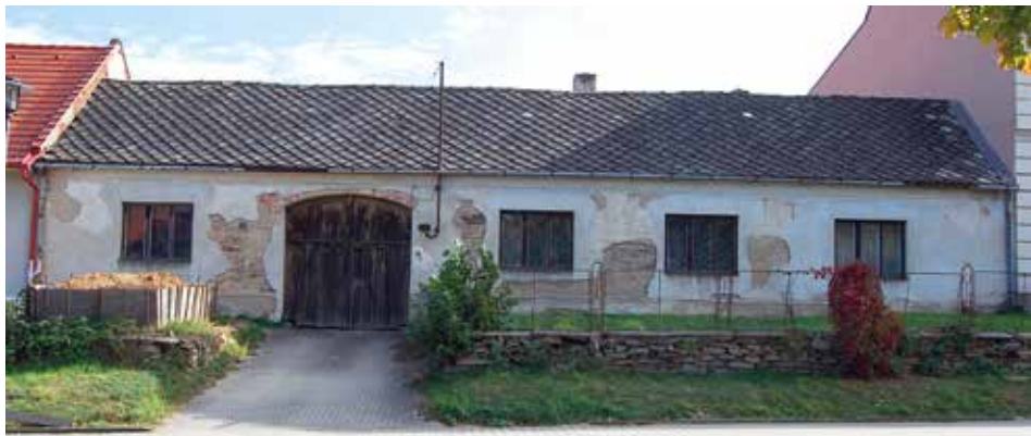
Dům čp. 114 v současnosti.