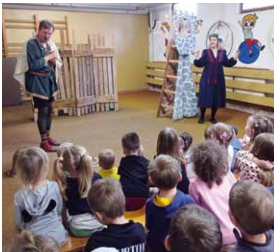
Pohádka O Zlatovlásce.

t. j. do Mateřské školy Masarykovo náměstí (včetně MŠ Lánice) a Mateřské školy U Stadionu se koná ve čtvrtek 9. května 2024 v době od 8.00 do 15.30 hodin .