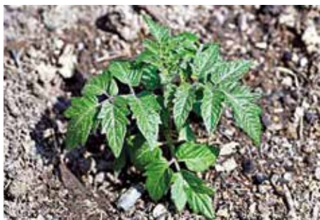
Zelený SWAP.