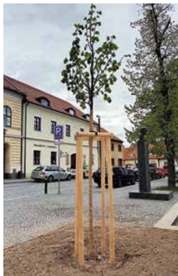
Nová lípa na náměstí.

Vážení občané Velké Bíteše, v rámci obnovy zeleně na Masarykově náměstí byla dne 9. 4. 2024 vysazena nová lípa svobody jako pokračovatelka symbolu vzniku samostatného Československa – lípy z roku 1919. Při výsadbě bylo dbáno na důkladnou přípravu stanoviště tak, abychom lípě zajistili dobrou prosperitu na několik desetiletí dopředu. Pro výsadbu byl zvolen dle požadavků Národního památkového ústavu shodný taxon jako u lípy předchozí, tedy lípa velkolistá Tilia platyphyllos . Pokud strom dobře zakoření a bude prosperovat, vytvoří se tak opět zelená dominanta náměstí s přesahem do symboliky významné historické události.