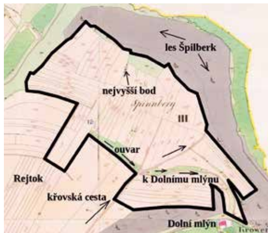
Tratě „Špilberk“ v pravděpodobných hranicích josefinského katastru z 18. století. Do mapy stabilního katastru z roku 1825 zakreslil autor.

Seriál o historickém katastrálním území Velké Bíteše, jehož hlavními prameny jsou josefinský katastr z let 1785–1789 a městské pozemkové knihy. Nyní ŠPILBERK.