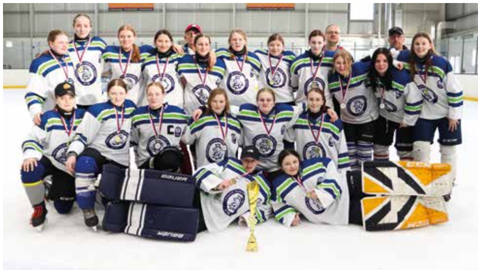
Společné foto.

Na tomto turnaji se sešlo přes 130 hokejistek ročníků 2009 – 2012, aby vytvořily osm regionálních týmů, které se mezi sebou utkaly o první titul Mistryně ČR v ledním hokeji v dívčí soutěži. Prosadily se dva týmy z Moravy, které obsadily druhé a třetí místo.