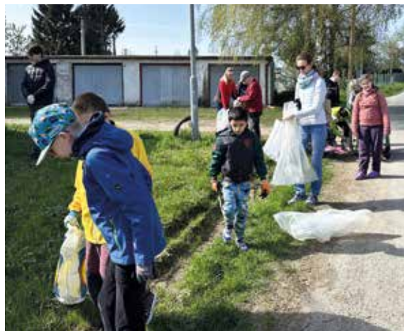
Z akce.

Dne 11. dubna 2024 se naše škola zapojila do veřejné akce úklidu Vysočiny. Žáci jsou ve výuce seznamováni s problematikou odpadů a učí se tak odpady pokud možno nevytvářet, odpady, kterým se nelze vyhnout, pak třídít a recyklovat. Při jarních vycházkách se však ukazuje, že přece jenom některé odpady nejsou zařazeny do správných kontejnerů a jsou volně pohozené po okolí. Proto jsme se připojili k pomoci přírodě a zatoulané obaly a různé nečistoty posbírali a nasměrovali na správnou cestu.