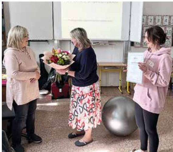
Udělení certifikátu.

Kurz byl zacílen na smysluplnost aktivit směřovaných na práci s prožitkem, seznámení se smyslovými vjemy, smyslovými prahy, aktivaci a vytváření smyslové paměti. Mnohé z nás překvapilo, že dle konceptu Snoezelenu disponujeme až 12 smysly. Účastníky kurzu čekal odborný vhled do oblasti neurovědy a neurodidaktiky. Vzdělávání bylo mimo jiné prakticky zaměřeno na užití taktilně haptických pomůcek a jejich důležitost pro využívání ve vzdělávání. Pedagogové se věnovali také tomu, jak při své terapeutické práci využít aktivaci propojení hemisfér přes střed těla, práci s vibracemi, teplem, aktivitám zacíleným na smyslové vnímání jednotlivých částí těla a vnímání polohy a pohybu, což je pro jedince s handicapem často problémové.