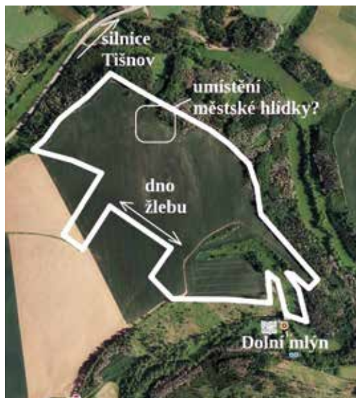
Josefinská trať „Špilberk“ na satelitním snímku z roku 2022. Do snímku www.mapy.cz zakreslil autor.

Položku č. 27 představovala erodovaná půda s jalovou skálou. Položka č. 30 se nacházela na vyvýšenině, na které se v jednom místě zachytávala ve skalní nádrži dešťová voda, která následně způsobovala erozi okolní půdy. Položku č. 35 představovalo malé místo z kamenů a písku. U obecní role č. 37 se pod položkou č. 38 nacházela vyvýšenina s erodovanou půdou s kameny. Položkou č. 40 bylo místo, které podobně nemohlo být využíváno kvůli erozi a skalnímu výchozu. Malá obecní role č. 42 (26x4 sáhů, tj. 49x8 metrů) se nazývala „Hřebílko“ asi proto, že se nacházela na hřebeni kopce. Podobně položku č. 44 představovala vyvýšenina, která kvůli erodované půdě s kameny nepřinášela zemědělský užitek. Položkou č. 46 byla již zmíněná pojezdná cesta do mlýna a následující role č. 47 ležela podle křovské cesty. Předposlední roli č. 48 (45x8 a 50x17 sáhů, tj. 85x15 a 95x32 metrů) zdědil janovický poddaný v roce 1778. Tehdy byla role pod dvě míry výsevku uvedena tak, že leží „nad Dolním mlejnem vedle cesty křovskéj z jedné strany a vedle stezky do Dolního mlejna z druhé strany“.