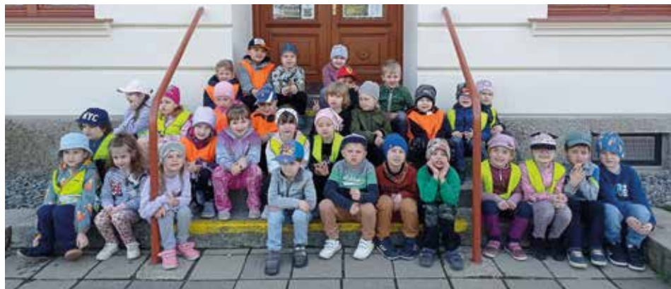
Předškoláci na návštěvě Základní školy.

Ani v dubnu nechybělo divadlo, tentokrát k nám zavítalo Divadlo Jaromír a bylo to opravdu povedené představení. Děti zhlédly pohádku O Zlatovlásce v moderním a netradičním pojetím. Bylo to představení plné humoru, při kterém se nasmály i paní učitelky. Děti byly nadšené a my toto divadlo rádi uvítáme zase někdy příště.