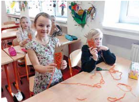
Velikonoční dílny. | Foto: Milada Sklenářová

Velikonoční dílny pro třetí ročník, které se konaly v úterý 26. března, nabídly žákům možnost zapojit se do sedmi různých aktivit. Jednou z nich byla tvorba anglických velikonočních klobouků, známých jako Easter bonnet. Další činnosti zahrnovaly velikonoční matematiku nebo byly zaměřené na tradice a zvyky tohoto období. Také tělesná výchova byla přizpůsobena tématu Velikonoce, kde se děti mohly zapojit do her a cvičení inspirovaných jarním