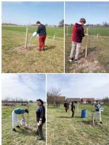
Výsadba sadu.

Záměr se potkal s možností využití grantového programu Sázíme budoucnost Nadace partnerství Brno. Po předložení našeho záměru nastal čas očekávání, zda bude žádost o grant úspěšná a potvrzení přidělení grantu skutečně dorazilo. Připravil se plán výsadby a čekalo se na vhodné počasí pro výsadbu a současně se chystal pozemek. Záměr byl dokončen v období velíkonočních svátků a dnes je již sad připraven začít plnit svou funkci. Při výsadbě samozřejmě asistovali občané Jáchymova, kteří také budou mít na starosti jeho dlouhodobou udržitelnost a obecně starostlivost o něj.