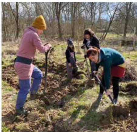
Příprava záhonů.