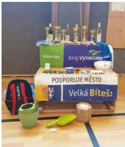
Ceny pro vítěze.