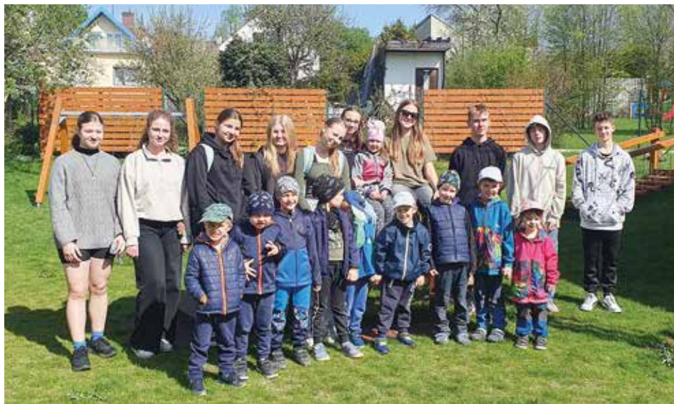
„Volba povolání“.