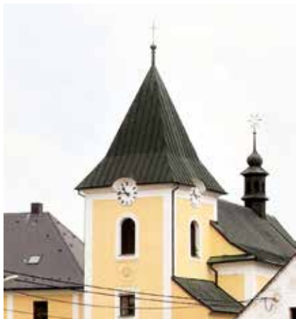
V které obci nedaleko Velké Bíteše se nachází vyobrazený kostel?

Výhercům, kterým byla předána malá pozornost, gratulujeme.