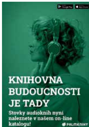
E-výpůjčky. | Zdroj: Palmknihy