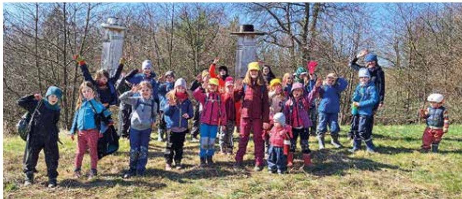
Na cestě ze Křoví.

Střeďeční výpravy přinesly typicky jarní objevy. Na farmě ve Křoví , na kterou nás pozvali naši žáci, je každou chvíli nějaký přírůstek a mají tam plné ruce práce. Proto asi kluci trénují jedno z telátek, aby chodilo na pastvu samo. Cestou zpět všechno kolem zpívá, kvete, bublá – kam se dřív podívat? Třeba do tůňky na žabí vajíčka, příště už tam možná budou pulci.