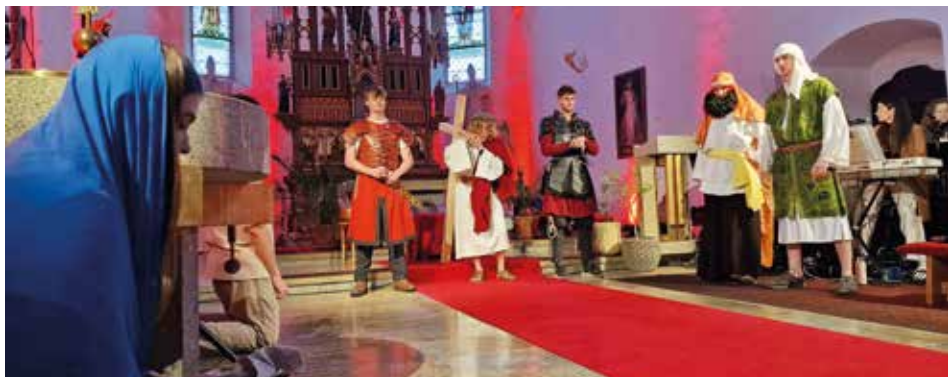
Velikonoční příběh ztvárnilo téměř 50 dětí a mládeže.

Poděkování spolupracovníkům za přípravu a průběh velikonočních svátků ve farnosti: ministrantům, farnímu souboru, Pomněnkám, varhaníkům, lektorům, za květinovou výzdobu, úklid kostela a také vám, kteří posvěcujete farní život modlitbou a svým nesením osobního kříže.