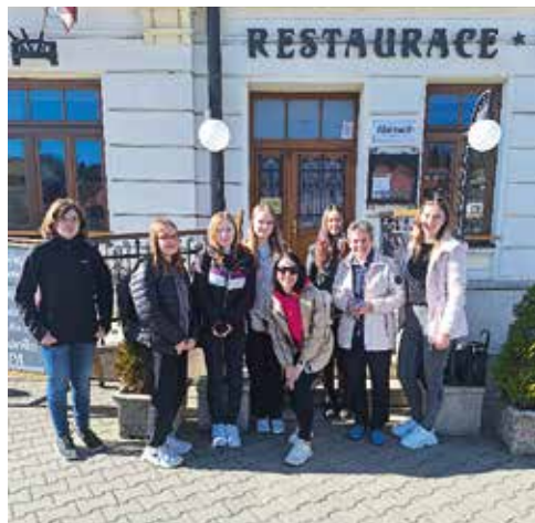
U Jelínkové vily.

Žáci se dozvěděli, že se zde vaří pivo Harrach, které je pojmenováno po jednom z majitelů místního zámku. Vzniká tradiční rukodělnou metodou a poctivou českou cestou „varna – spilka – sklep“. Majitelé za něj byli už mnohokrát oceněni, mj. Českou pivní pečetí a označením Regionální potravina. Ve vile jsme absolvovali prohlídku, během níž jsme získali informace o její historii a výrobě piva. Měli jsme také výklad u varných kádí, sestoupili do sklepení a zhlédli technologii a ochutnávku piva přímo z pivních tanků. Zájemci z veřejnosti mohou vyzkoušet světlý ležák Original, tmavý ležák, vídeňský speciál a pšeničné pivo.