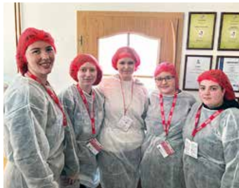
Z exkurze v POEXu.

Návštěva firmy Poex, která se zabývá výrobou oříšků a ovoce v čokoládě, čokoládových mincí, cukrovinek, müsli, extrudovaných výrobků a pochutin, byla pro žáky velkým přínosem. Firma má ve Velkém Meziříčí celkem 3 pobočky. S žáky jsme navštívili výrobní, která se nachází na ulici Třebíčská. Zde se zpracovávají již zmíněné ořechy v čokoládě a další čokoládové výrobky. Měli jsme možnost nahlédnout do procesu: od základního opracování surovin, jejich namáčení do čokolády ve speciálních bubnech přes