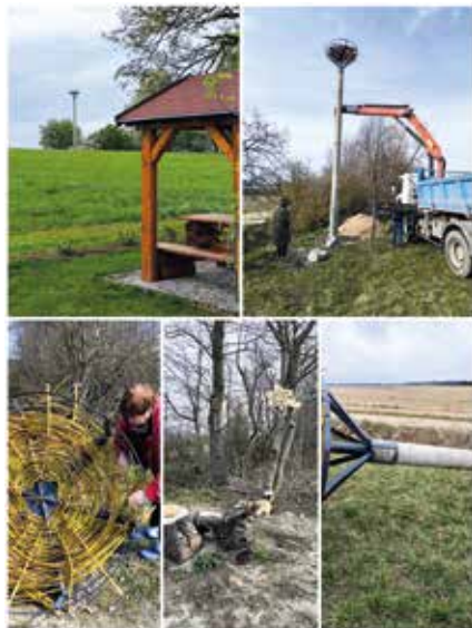
Vybudování hnízda pro čápy.