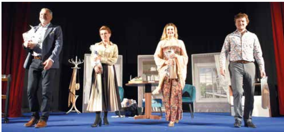
Závěrečné společné foto.

času hlídají. To vše až do dne, kdy před rodiči dojde mezi Lucasem a Manon k prudké hádce. Manon má totiž milence a odjíždí s ním na dovolenou.