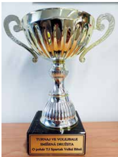
Vítězný pohár.

Ryctví Mihal. Družstva na prvních 3 místech dostala tradiční poháry. A o co se to vlastně hrálo? Podívejte se na fotku.