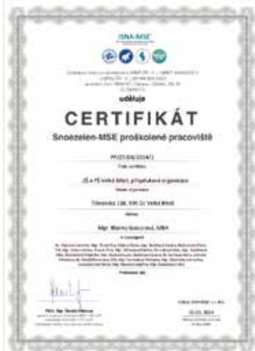
Certifikát.