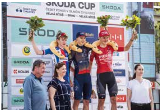
Stupně vítězů.