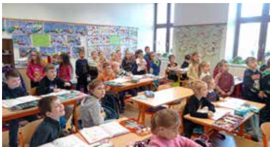
Návštěva v ZŠ.