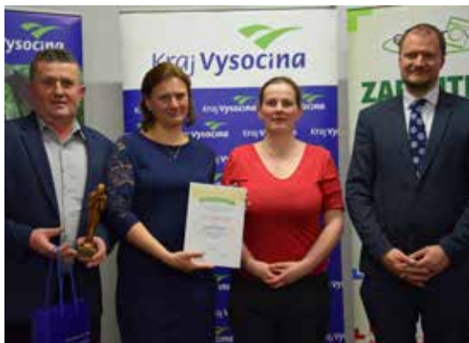
Předání ceny pro Velkou Bíteš.

systemu Asekol, a.s. obdržely obce finanční částku 30 000 Kč a v doplňkové soutěži kolektivního systému Elektrowin, a.s. obdržely obce finanční částku 10 000 Kč. Pro všechny zúčastněné byla připravena zajímavá prohlídka Muzea nové generace v zámku ve Žďáře nad Sázavou, kde je interaktivní a multimediální expozice, a na závěr i občerstvení, během kterého si zástupci obcí sdělovali své zkušenosti nebo poznatky během práce v odpadovém hospodářství.