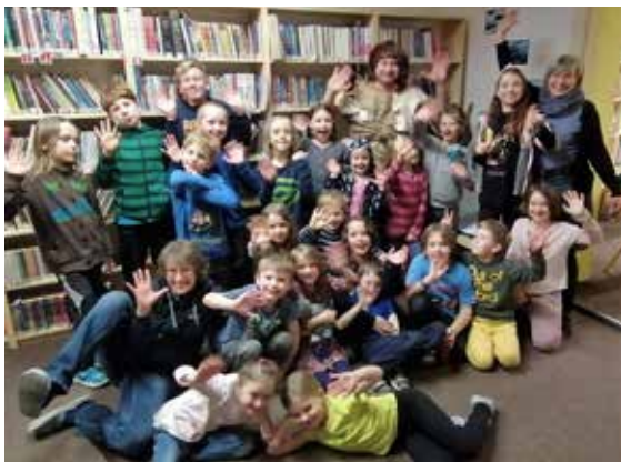
Noc v knihovně.

Milý Robinsone, díky za odpovědi i banány z „Banánové zátoky“.