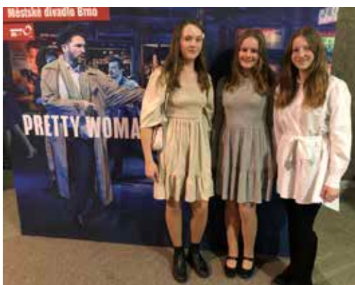
Divadelní představení.

V sedmnáctý březnový podvečer se podruhé v tomto školním roce uskutečnila návštěva Městského divadla v Brně. Jestli se někdo obával, že notoricky známá Pretty Woman nás ničím nepřekvapí, byl velmi rychle vyveden z omylu. Divadelní zpracování a úžasná hudební scéna nám poskytla zcela jiný kulturní zážitek, než nabízí oblíbený film. Tři hodiny utekly jako voda a nikdo se ani minutu nenudil.