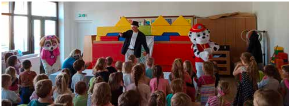
Kouzelnické představení.

V úterý 21. března 2023, druhý jarní den jsme se sešli u školky na náměstí, abychom vynesli Morénu a přivolali tak jaro. Po milém přivítání všech účastníků průvodu od paní ředitelky a paní starostky se průvod za zpěvu písniček a recitace básniček vydal kolem kostela a dále Tyršovou ulicí ke školce v Lánicích. U školky jsme zapálili malou Morénu