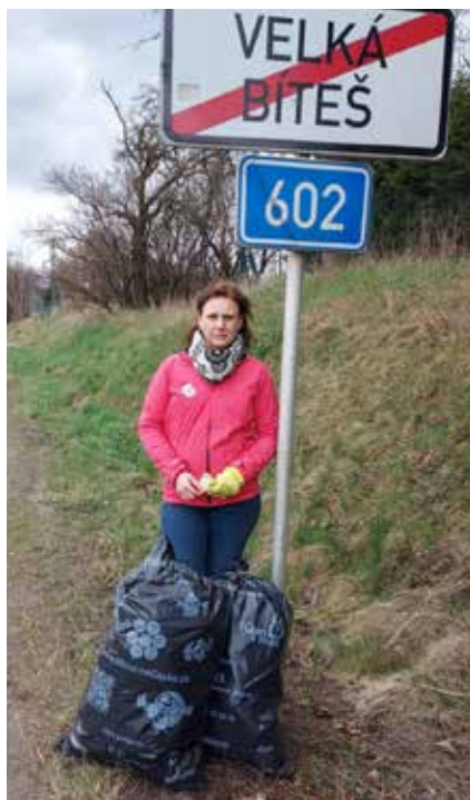
I paní starostka se na úklidu podílela jako každý rok.

Troufám si říct, že všech 34 lidí (včetně 8 pořadatelů + rodina) z Velké Bíteše, kteří přišli na akci „Uklidme Velkou Bíteš“, udělalo velký kus práce a za to jim patří moje veliké poděkování.