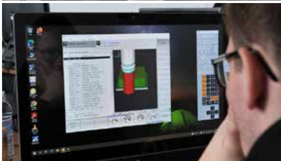
Ze soutěže.