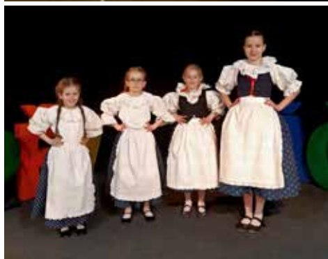
Ze soutěže.