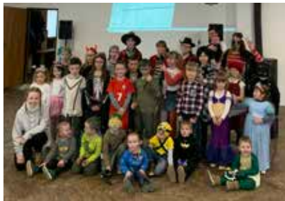
Z karnevalu.

V sobotu 11. března se v Holubí Zhoří uskutečnil dětský karneval. Karneval pořádal místní BABY CLUB a nově vzniklá JEDNOTA OREL. Karneval je den, kdy se děti mění v jejich oblíbené super hrdiny, pohádkové postavy apod., a proto nám po kulturním domě nám běhaly princezny, víly, kovbojové, želvy Ninjové, indiáni, Batmani a spoustu dalších. Pro děti byly připravené soutěže, čas mezi soutěžemi vyplňovaly tancováním na jejich oblíbené písničky.