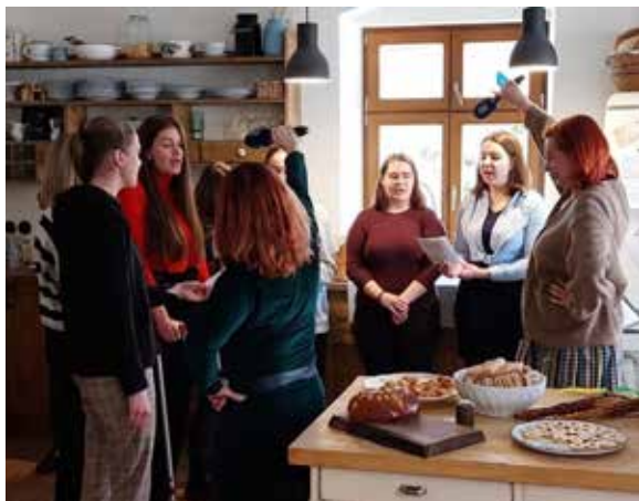
Z vysílání.