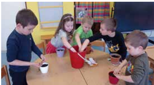
Velikonoce v MŠ.

To, že koncert nemusí být nuda, měli předškoláci možnost poznat díky základní umělecké škole. Zazněly rozmanité hudební nástroje