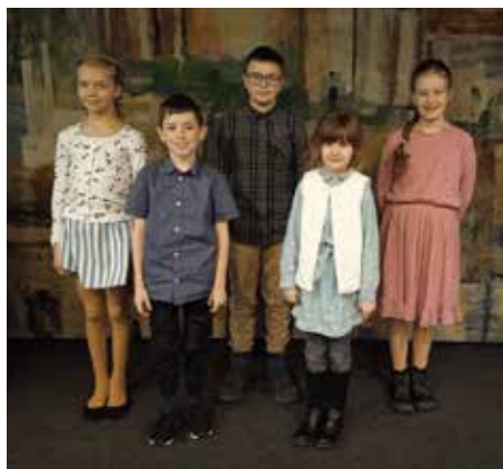
Soutěž v sólové recitaci.