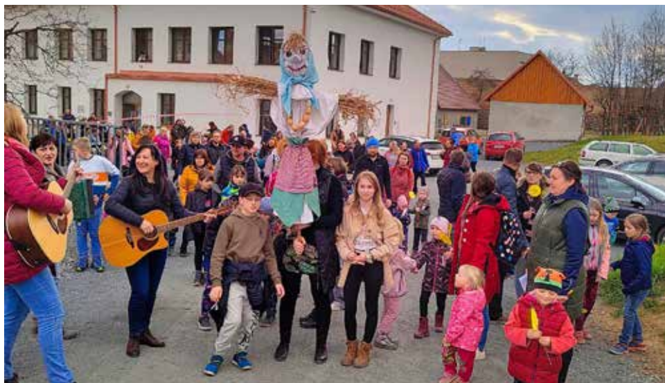
Výnášení Morény.

a vhodili ji do říčky Bítýšky a tím zahnali zimu. V Lánicích si ještě děti nazdobily „líta“, která teď zkrášluje obě budovy naší školky. Pro všechny děti, které pomohly svým zpěvem jaro přivolat, byl nachystán dáreček v podobě jarního zápichu. Počasí nám opravdu přálo a také účast byla velice hojná! Proto děkujeme všem dětem a jejich rodičům, kteří nám po dlouhém čase pomohli přivolat jaro. Dále děkujeme Městské policii Velká Bíteš za zajištění bezpečnosti průvodu a panu Hotárkovi za hudební doprovod.