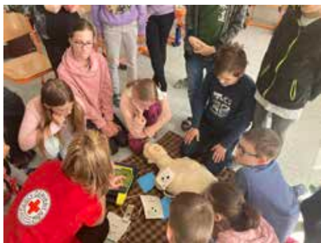
První pomoc.

Ve všech třídách pátého ročníku proběhla ve čtvrtek 23. března velmi zajímavá přednáška. Zástupci Českého červeného kříže ze Žďáru nad Sázavou přijeli dětem ukázat základy první pomoci. Žáci si vyzkoušeli, jak postupovat při ošetření zraněného člověka nebo člověka v bezvědomí. Naučili se např. správné provedení srdeční masáže nebo použití obvazových materiálů.