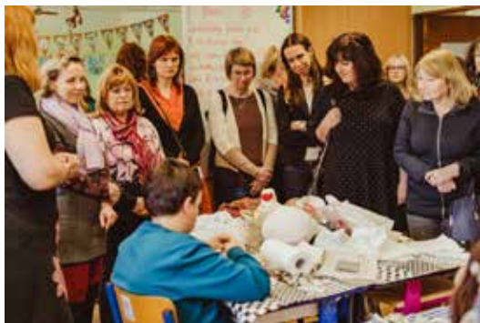
Velikonoční tvoření.

Tak jako každý rok nás navštívili zástupci zřizovatele, pedagogové z místních i okolních škol a školek, zaměstnanci speciálně pedagogických center a sociálních služeb, ale také rodiče žáků a ti, kterým zkrátka dění v naší škole není lhostejné. Tentokrát mohli návštěvníci ve třídách vidět tvoření spojené s Velikonocemi a někteří se k nám se zájmem připojili a zhotovili si jednoduchý výrobek.