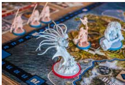
Deskovky v knihovně.

Hrajete rádi deskové a karetní hry? Chtěli byste se setkat s podobnými nadšenci nebo jenom okouknout, jaké nové hry jsme si pro vás v knihovně připravili? Srdečně vás společně