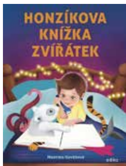
Honzíkova knížka zvířátek.