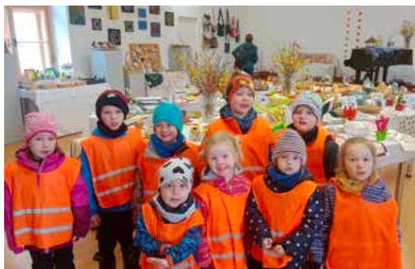
Berušky navštívily Velikonoční výstavu.

V úterý 11. 4. 2023 se ve třídě Sluníček v Lánicích uskutečnil Baby club . Paní učitelky si pro děti připravily bohatý a zajímavý program a děti a jejich rodiče si užili příjemné hrací odpoledne u nás ve školce.