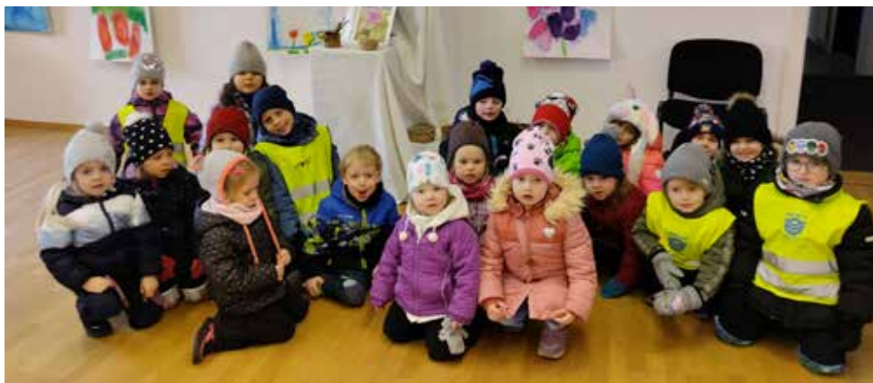
Sluníčka na výstavě „Jarní tání“.

pomlázku. Chlapci si přichystali na tuto akci pomlázku s košíčkem a krátkou velikonoční básničku. Děvčata zase přinesla různá vajíčka. Mohli jsme obdivovat vlastnoručně zdobená z papíru, perníková, čokoládová i tradiční. Před vlastní pomlázkou jsme si povídali o velikonočních zvycích a také o tom, co symbolizuje vyšlehání děvčat pomlázkou, žilou či tatarem, které by nemělo kamarádky bolet, ale i co znamená předávání vajíček od děvčat. Pak už vše začalo: chlapci si při odříkávání básničky Hody, hody doprovody od kamarádek postupně vymrskali bohatou velikonoční nadílku a navíc nové vlastnoručně vázané barevné pentličky na jejich pomlázky. Vše jsme zakončili společnou slavnostní hostinou, za kterou moc děkujeme maminkám, které přinesly velikonočního beránka, mazanec, perníčky i nadýchané sladké zajíčky.