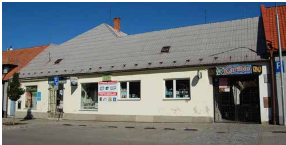
Dům čp. 59, který se stal před sto lety orlovnou, v současnosti.