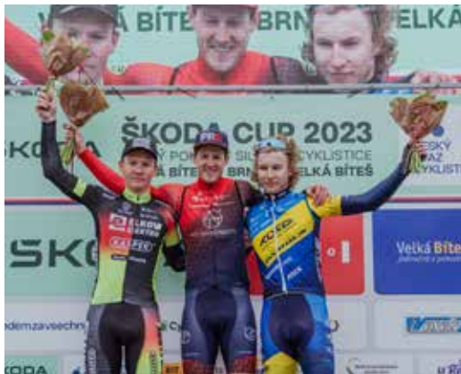
Stupně vítězů.