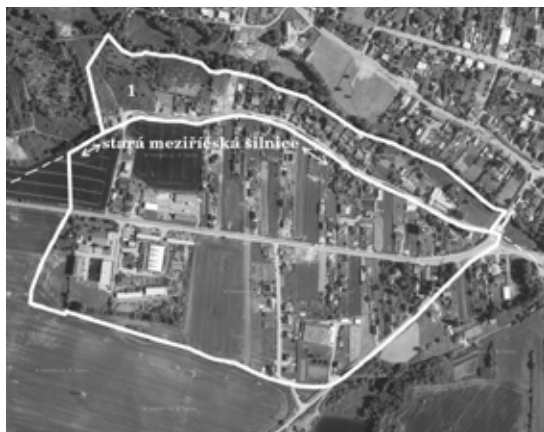
Vymezení tratí „Pod Spravedlností“ a „Ve Furtě“ na satelitním snímku z roku 2021. Do snímku www.mapy.cz zakreslil autor.

Menší josefinská trať „Pod Spravedlností“ zahrnovala 16 položek, z nichž devět bylo rolí, osm luk, tři pastviny a poslední položkou byla již zmíněná pojezdna hranicící tuto a dvě následující trati „Pod městem na loukách“ a „Ve Furtě“. Louky v této trati, které se nacházely blíže mostu, bývaly často zaplavovány, pročež z nich bývalo horší kyselé seno. Zde položkou č. 1 byla louka označená jako „Za potokem ve Furtě“ (11). Toto označení patrně platilo pro níže položené pozemky do třetiny až poloviny trati, do položky č. 7. U položek č. 7 (role s loukou a pastvinou) a 8 (role) se nacházel jakýsi neužitečný útvar bez udání