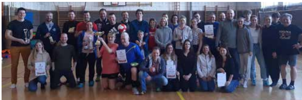
Společné foto.

Jak je tomu již zvykem, i tento rok se konal náš tradiční jarní volejbalový turnaj smíšených družstev. Opět se jednalo o oslavu amatérského volejbalu a celý turnaj se nesl ve velmi přátelském duchu utužování vztahů mezi jednotlivými týmy. Akce se zúčastnilo osm družstev spravedlivě rozložených do dvou skupin. První část týmů odehrála svoje zápasy v hale TJ Spartak a do boje o 1. a 3. místo postoupily týmy Tuhý&Kořínek ze Slavkova a domácí Tullamore. Druhá skupina hrála v tělocvičně ZŠ a do boje o cenné kovy postoupily týmy Koncovka Znojmo a z druhého místa SAKO. Samotné finále se pak odehrálo v hale TJ Spartak a pořadí bylo následující: 1. místo Koncovka Znojmo, 2. místo Tuhý&Kořínek, 3. místo SAKO. Všem vítězům moc gratulujeme a děkujeme všem ostatním zúčastněným týmům, tj. Tullamore, Kotlanda Tišnov, Frantíkovci, Pláčačky Tišnov a NejenŽeny. Velké poděkování patří i restauraci Na 103, která po konci posledního utkání přijala hladové sportovce a poskytla jim příjemné prostředí k pozápasovému zotavení po sportovních výkonech.