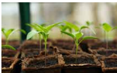
Zelený swap.

domov. SWAP bude otevřený v rámci výpůjční doby.