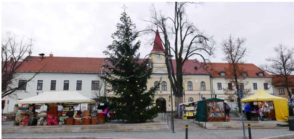
Bítešské trhy na Masarykově náměstí.

Lenka Povodová a Informační centrum a Klub kultury pro občany Velké Bíteše připravily Bítešské trhy i v letošním roce. Trhy se uskuteční ve středové části Masarykova náměstí jednou za měsíc, a to vždy v úterý: 16. března, 20. dubna, 18. května, 15. června, 20. července, 17. srpna, 21. září, 19. října, 16. listopadu a 14. prosince.