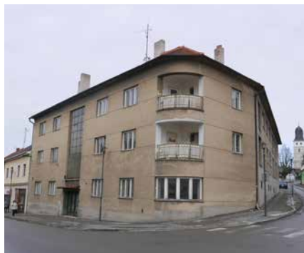
„Bývalý pivovar“.

stor tohoto domu, ať k využití potřebám zájmových kroužků, tak i občanům našeho města. Podle této studie bude možné v budoucí době požádat o grantové programy na opravu a rekonstrukci celé budovy tak, aby zapadala do kontextu pěkných historických budov na Masarykově náměstí.