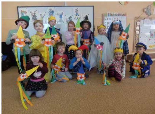
Masopust v MŠ.

školky. Také tradiční vynášení Morény bude přizpůsobeno tak, aby si ho děti užily a přítom se dodržela veškerá opatření. A pokud tohle složité období potrvá až do léta, děti nepřijdou ani o svůj výlet. Paní učitelky ho připraví a bude fajn, i když možná zase jen „jako“.