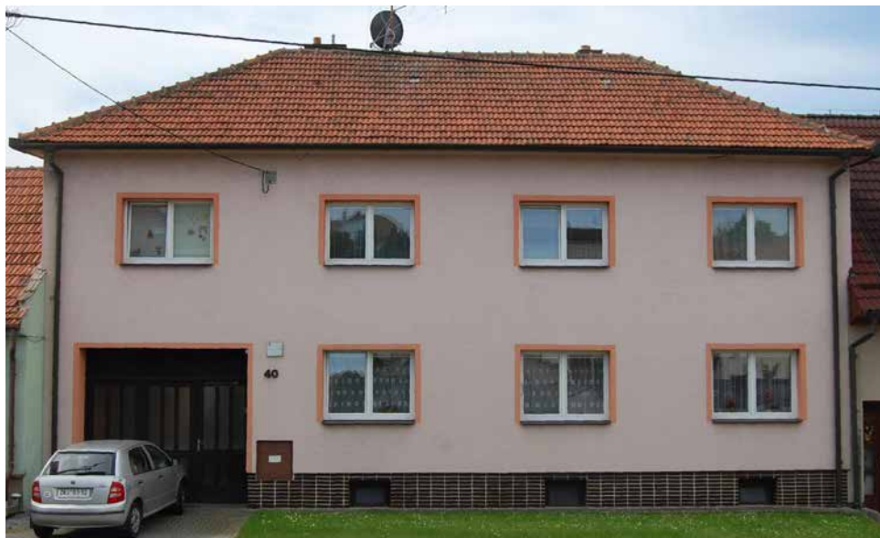
Dům čp. 40 v současnosti.