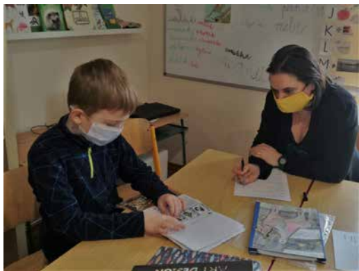
Pololetní přezkušování žáků.

pojenost prezentovaných projektů do praktického využití. Děti se vždy na přezkoušení nepokrytě těší, neboť v tento den se mohou pochlubit a představit svá portfolia i další práce za celé pololetí. Přezkoušení je ukončeno navrhnutím známek pro vysvědčení, ke kterému je přiloženo i slovní hodnocení od jejich učitelky Tani Filipové, shrnující každodenní práci a pokroky nejen ve faktických znalostech, ale i v sociálních dovednostech dětí. Toto osobní slovní hodnocení dává reflexi dítěti i celé rodině za uplynulé pololetí a má vzhledem k obsáhlosti větší vypovídací hodnotu než pouhá známka.