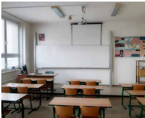
Modernizace učeben.