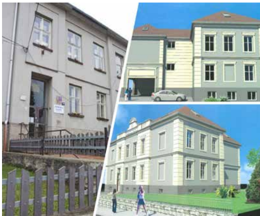
Fotokoláž školy.

Každodenně jsou využívána sluchátka s mikrofony a webové kamery. Standardní vybavení učeben tvoří počítač s připojením k internetu. Je opatřen vizualizérem (slouží pro promítání studijních materiálů v papírové podobě na obrazovku, respektive na plátno v dané třídě) a je připojen k projektoru, který umožňuje nejen promítání učiva, ale i zápis na tabuli.