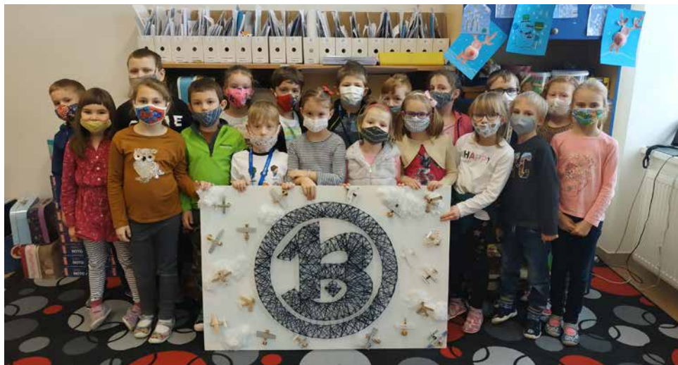
Třída 1.A a vítězné logo PBS.

První brněnská strojírna ve Velké Bíteši, známá svou leteckou výrobou, slaví v letošním roce 70. narozeniny. Při této příležitosti vyhlásila soutěž pro žáky základních škol. Zadáním soutěže bylo zpracovat libovolnou kreativní technikou 3D logo První brněnské strojírně ve Velké Bíteši a nahrát krátké video s přáním do dalších let. Soutěže se mohly účastnit týmy všech ročníků základních škol. Vyhlášení vítězů soutěže proběhlo 11. února 2021. Na prvním místě se umístila třída 1.A, druhé místo získala 4.A, třetí místo 2.D a čtvrté místo 2.C. Soutěžní týmy, které se umístily na prvních třech místech, získaly štědrou finanční odměnu.