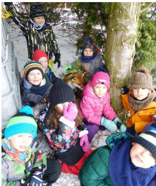
„Zimní stopovaná“.

do vesmíru vlastnoručně vyrobenou raketou, do pravěku na lov mamuta, z hlíny si vyrobily pravěké misky nebo do ní zkusily zanechat stopu trilobita, sledovaly výbuch sopky a řinoucí se lávu z kráteru.