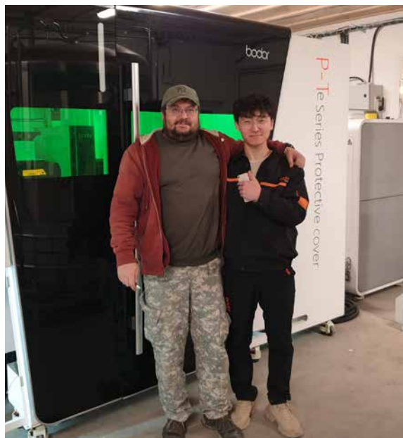
Předání nové technologie řezání laserem.

Naše firma se zabývá svářečskými pracemi, zejména zpracováním plechů a malosériovou i zakázkovou výrobou strojních částí. Dlouhodobě spolupracujeme s firmami z oblasti potravinářského, strojírenského, vodohospodářského i zbrojního průmyslu, a díky tomu se lze s našimi výrobky setkat téměř po celém světě, až se sám někdy divím, kam až je naši zákazníci dodávají. Dlouhodobě podporujeme také místní rybářský spolek, fotbalisty a oddíl juda.