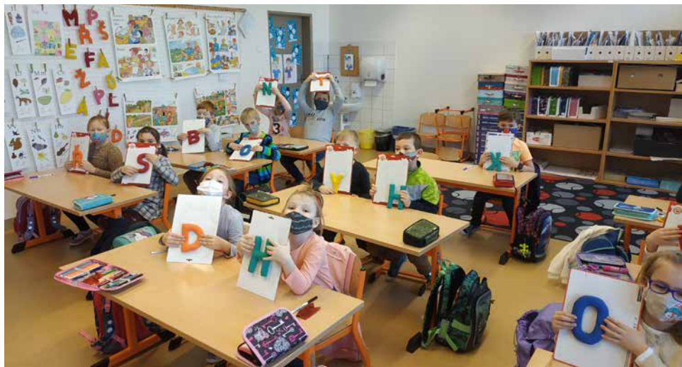
Prezenční výuka 1. třídy.

Děti také připravovaly své kresby, malby či grafiky do XXI. ročníku celostátní výtvarné dětské soutěže „Příroda kolem nás“ pro Správu Národního parku Podyjí. Posláním soutěže je zachytit prchavé a neopakovatelné pozitivní prožitky dětí, které získaly na svých toulkách přírodou, a umocnit v nich vliv přírody na rozvoj jejich ekologického citění a vnímání. Cílem soutěže je oslovit a zaujmout děti a probudit v nich zájem o naši přírodu. Vybraná díla v několika kategoriích budou zveřejněna na webu Správy Národního parku Podyjí a následně vystavena v návštěvnickém středisku v Čížově.