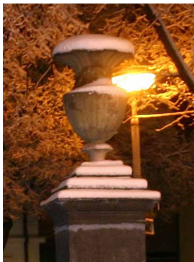
Poznáte známé místo?