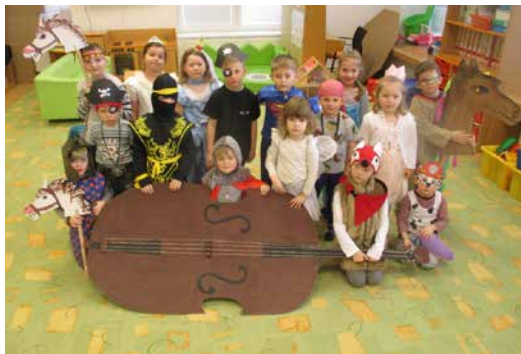
Masopust v MŠ.

V této nelehké době je spousta omezení, a to i ve školce, proto se paní učitelky snaží, aby se dětí dotkla co nejméně. Tak si děti užily nejen masopust, ale vydaly se také na cestu