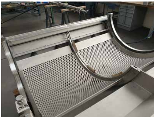
Jeden z mnoha výrobků firmy.

V noci se potom z rádia dozvěděla, že jsem se narodil v den, kdy naše republika dosáhla 15-ti milionů obyvatel, a děti, které se narodily mezi 16.00 až 18.00 hodinou budou patnáctimilionovými občánky.