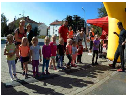
Kategorie dětí na startu.

vých, velký běžecký talent. Co je ale nejdůležitější, panovala přátelská a PoHodová atmosféra a i na dětech, které neobsadily přední příčky, byla vidět radost z pohybu.