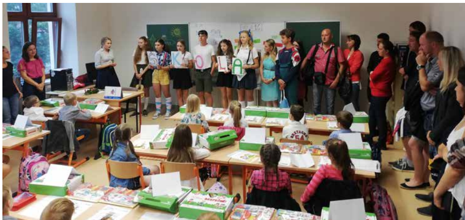
Vitání prvňáčků.