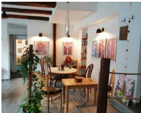
Ateliér 13.

Autorská díla Mgr. Veroniky Bártové si můžete v těchto dnech od 9.00 do 20.00 hodin spolu s výstavou fotografií Renaty