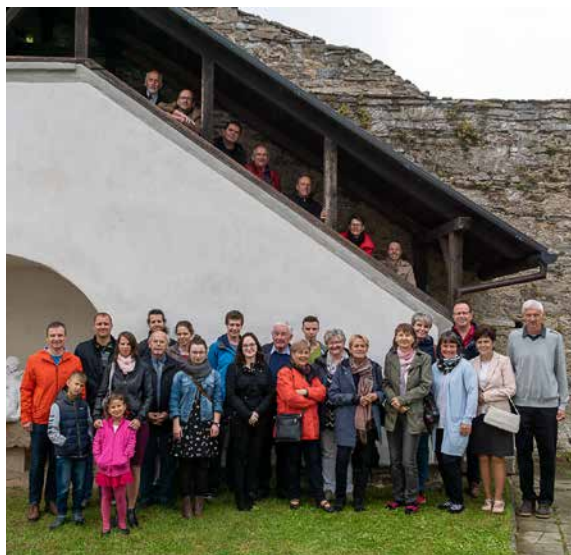
Společné foto.

Ačkoliv nám sobotní počasí moc nepřálo, vypravili jsme se po snídani v rodinách na prohlídku poutního kostela Svatého Jana Nepomuckého na Zelené hoře a klášterního muzea. To nás velmi mile překvapilo svým moderním a netradičním zpracováním prohlídky – návštěvník dostane do dvojice audio zařízení se sluchátky, na kterém poslouchá mluvený text k expozicím. Části výstavy se ovšem různě pohybují, přehrávají či rozsvěčují a výsledný efekt je opravdu působivý. Plni dojmů jsme návštěvu Žďáru završili výborným obědem v místní restauraci a už jsme se přesouvali na prohlídku kostela Navštívení Panny Marie v Obyčtově, který byl stejně jako stavby na Zelené Hoře velkoryse navržen architektem Santinim.