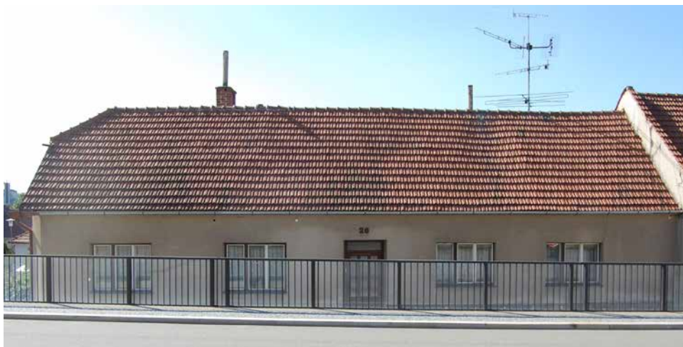
Dům čp. 26 v současnosti.