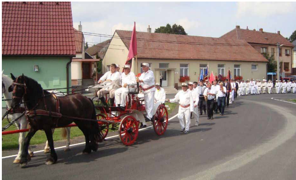
Slavnostní průvod vesnicí.

vykácené místo, možná Heřmanova paseka . Lze tedy předpokládat, že ves vznikla ve 13. století, jako ves kolonizační, a že jejím zakladatelem (lokátorem) byl nějaký Hermann.