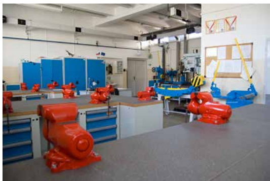
Nové pracovní stoly.

V první dílně, kde se žáci učí ručičným zručnostem, byly v době hlavních prázdnin zakoupeny nové pracovní stoly, provedeny nové omítky včetně nátěrů radiátorů a železných konstrukcí, dílna byla vymalována, byly zakoupeny nové židle. Za všechny tyto opravy a vynaložení nemalých finančních prostředků je nutno poděkovat zřizovateli – První brněnské strojírně Velká Bíteš, a. s. (PBS).