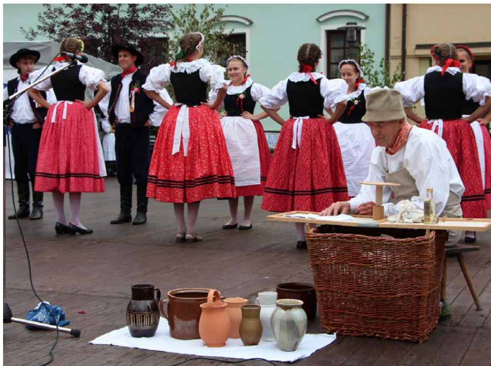
Dobře vypálené - hrnčířské pásmo mládeže Bítešanu a hostů.