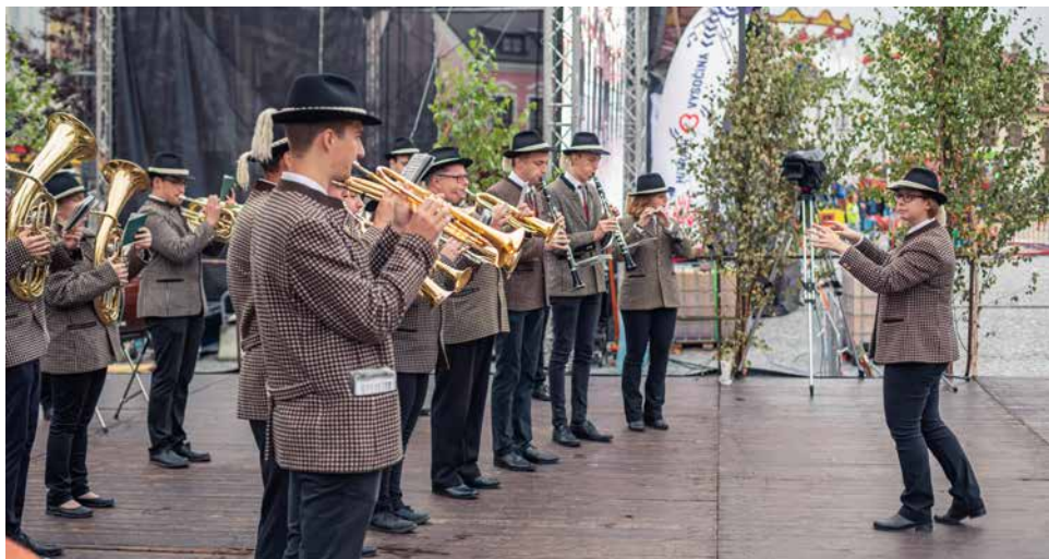
Vystoupení rakouské Ortsmusik.

Proběhlo ve dvou etapách. V první, patnáctiminutové prezentaci na konci Podhoráckého festivalu, a potom v druhé, hlavní části, po vložení vystoupení jejich krajana Lea Abe-rera. Byly jisté obavy, jak v této konfrontaci hostující dechová hudba obstojí, ale výsledek byl překvapující. Nejen počtem přihlížejících v nestálém počasí, ale také ohlasem, který vystoupení Rakušanů vzbudilo, a to překvapivě, u všech generací.