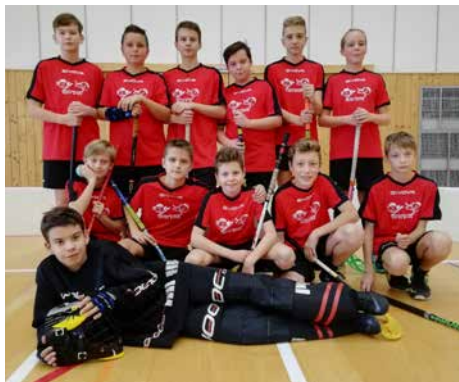
Společné foto z florbalu.

jenže v rozhodujících chvílích v semifinále nedokázalo ubránit jednobrankový náskok a podlehló svému soupeři v prodloužení. Malou útěchou pro ně nakonec byla výhra v boji o 3. místo. Individuální ocenění za nejlepšího střelce turnaje získal Jiří Vrzal (6 gólů).