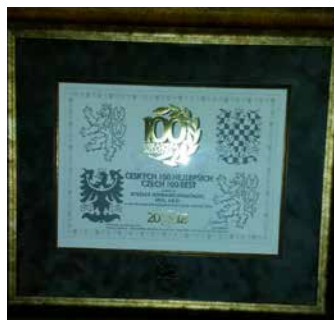
Ocenění pro BDS.

Firma BÍTEŠSKÁ DOPRAVNÍ SPOLEČNOST byla založena v roce 1992, současné době je matkou skupiny firem BDS-BUS a BDS-TRUCK a NTC. Tato skupina dosahuje v současné době obrát cca 1 miliardu Kč, provozuje 325 vozidel a zaměstnává cca 400 pracovníků. Ročně incestuje nejméně 75 milionů Kč hlavně do obnovy dopravní techniky, technologií či staveb.