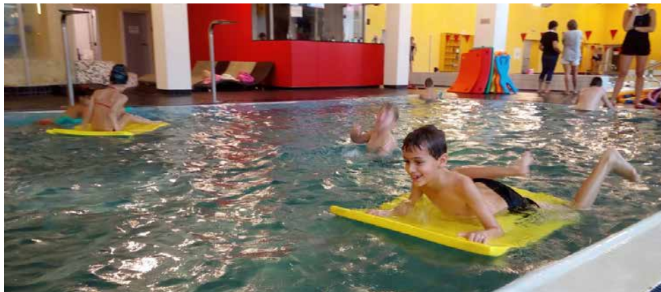
Z plaveckého výcviku.

Koncem listopadu se žáci naší školy zúčastnili poslední lekce plavání. Plavecký kurz probíhal ve Wellness Kuřim a pod dozorem zkušených lektorů absolvovali žáci celkem deset lekcí. Pro mnohé děti to byla první návštěva bazénu a nutno podotk-