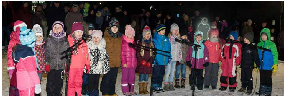
Vystoupení dětí z MŠ.