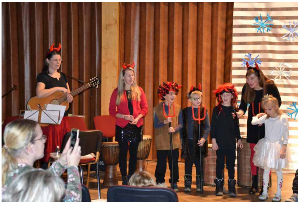
Čertíci a čertice na besídce.

Slyšeli jste v úterý 4. prosince chřestění řetězů a podivné zvuky? Kdekdo by si mohl myslet, že se pekelníci spletli a vyrazili na svět o den dříve. Ale místo z pekla začali se čertíci a čertice rojit z naší školy a mířili do kulturního domu na besídku. Jak již tušíte,