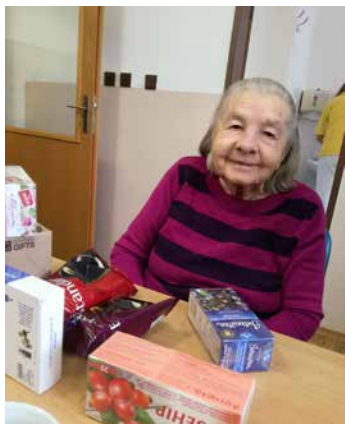
Dárky udělaly radost.

Letos poprvé se náš Domov důchodců zapojil do projektu „Ježíškova vnučata“. Několik klientů vyjádřilo svá přání, co by jim udělalo k Vánocům radost. Většinou to byly drobné dárky jako hrníček, kalendář, vlna na pletení ponožek, ale jeden klient měl jako přání dokonce i tahací harmoniku. Všechny dárky byly klientům doručeny osobně nebo poštou nejen z různých oblastí republiky, ale i z našeho města a blízkého okolí. Radost byla veliká a i slzičky dojetí se objevily. Je krásné, že i v dnešní uspěchané době si někdo vzpomene na seniory a snaží se udělat prostě jen radost. V příštím roce se určitě rádi zapojíme znovu.