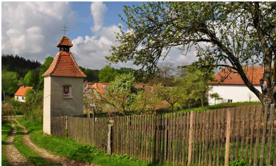
Zvonička v obci.

Je tady krásně, užíváme si každé roční období a díky blízkosti Velké Bíteše nám tady téměř nic nechybí. Jestřabí je ovocnou zahradou Velké Bíteše. Snad jen zajíždění autobusu do obce by zlepšilo stávající stav, ale na tom se již pracuje. Také zásadní obnova silnice do Jestřabí by přišla vhod, cesta se roky pouze záplatuje a o nějaké rovnosti nemůže být ani řeč. Také její rozšíření od Bíteše po rozcestí na Jindřichov se již řeší, provoz je tam větší než byl dříve. Celkem vzato, žije se nám tady skvěle.