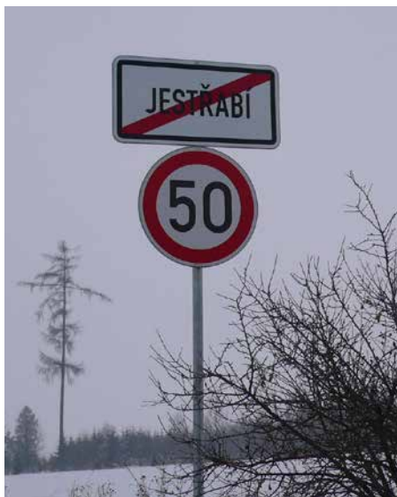
Nové označení konce obce.

Jsem tady spokojená. Jestřabí je malá vesnička a je tady klid, to je velká výhoda, která je však vykoupená špatnou dostupností a dopravní obsluhovaností. To pocítí zejména starší lidé, kteří musí k lékaři a za nákupy, a také školáci. Dříve sem jezdila alespoň pojízdná prodejna, uvažovalo se také o taxi pro důchodce. Ale jsme optimisté, dokonce si sami sečeme trávu kolem silnice. Jsem ráda, že se podařilo obec uzavřít dopravními značkami, protože už to bylo neúnosné. Po dokončení silničky na Březku se obec stala průjezdnou, cestu do Bíteše si takto zkracovali zejména jasičníci. Jinak věřím, že se podaří ta autobusová zastávka, potom oprava zvoničky a další, v tom jsme v OV za jedno.