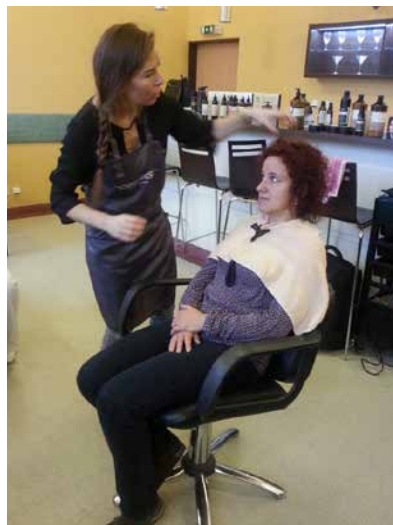
Praktická ukázka.

V průběhu semináře byla představena také balayage – aktuálně používaná barvicí technika, díky níž působí vlasy přirozeně a nadýchaně. Kromě toho se opticky zvětší jejich objem. Přírodní i dozlatova zesvětlené proužky dělají do-