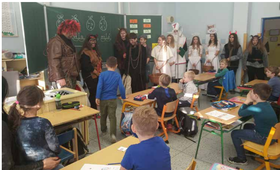
Mikulášská nadílka.

Návštěvník se může projít kajutami první, druhé i třetí třídy, prohlédnout si prostory kaváren i lodní podpalubí. K vidění je také téměř skutečný ledovec. Po obdržení lodního lístku se stanete skutečným pasažérem a na závěr se dozvíte, jaký byl váš osud.