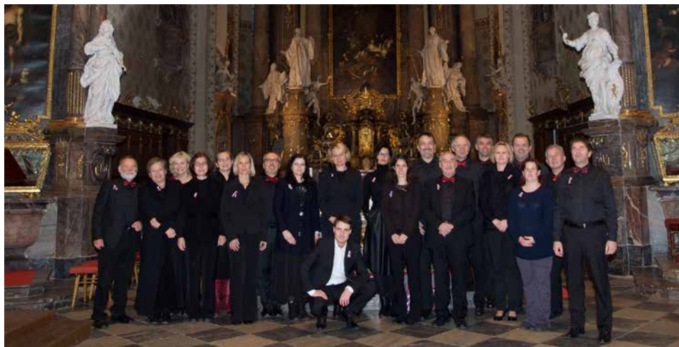
TIKO z Porta Coeli.

týšce, Kanicích, Tišnově a poslední koncert budeme mít v Horácké galerii v Novém Městě na Moravě.