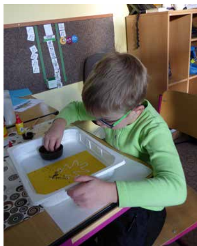
Výroba vánočních přání.