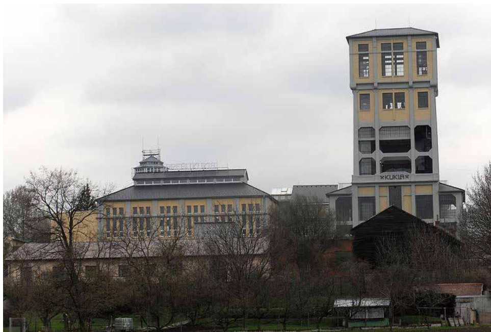
Bývalý důl KUKLA v Oslavanech.

V roce 1973 byla zrušena těžba uhlí na dole Nosek v Oslavanech. Takto byl důl nazýván až po roce 1947, před tím se jmenoval Kukla. Poslední vůz byl vytěžen z hloubky 881 m dne 31. srpna 1973. Ještě v roce 1963 na dole pracovalo 1058 zaměstnanců a potom byla činnost dolu postupně utlumována. Zbylí pracovníci byli převedeni do nově vzniklého závodu První brněnské strojírný, který byl lokalizován v povrchových prostorách zrušeného dolu. Měla se v něm vyrábět malá turbodmychadla, a to ve spolupráci s naším závodem.