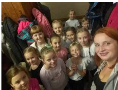
Oddíl Sportovní gymnastika – mladší žákyňe.

Jiřina Loupová, trenérka Sportovní gymnastiky