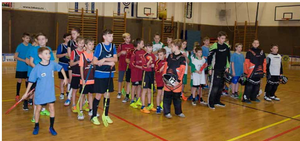
Společný nástup účastníků.

S blížícím se koncem roku se ve sportovní hale ve Velké Bíteši již tradičně sešli florbalisté 4. až 6. tříd aby mezi sebou poměřili síly. Turnaje se zúčastnilo celkem 6 týmů a to po 2 týmech z Velké Bíteše a Říčán, mužstvo Predators Dolní Kounice a tým Zbraslavi. Turnaj se hrál systémem každý s každým a první 4 mužstva v tabulce postupovaly dále do play-off.