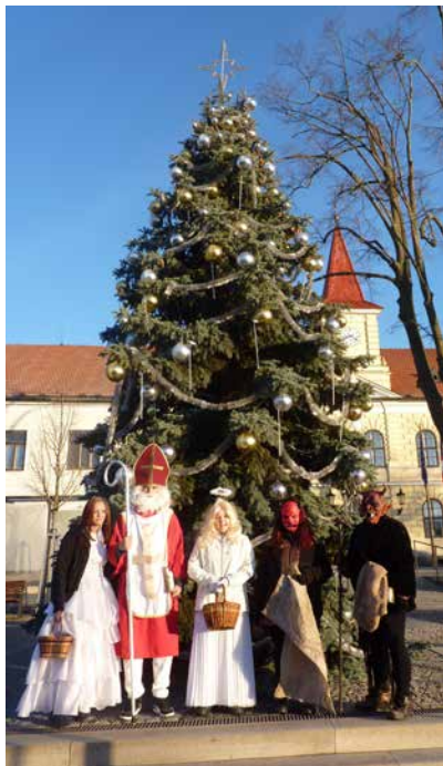
Mikuláš ve Velké Bíteši.

Mikuláš, andělům i čertům za jejich trpělivost a skvělý výkon.