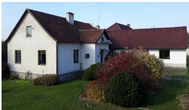
Dům čp. 171 v současnosti.

Seriál o domech a jejich majitelích na náměstí, v ulicích i na předměstích Velké Bíteše zabývající se dobou (již) před polovinou 20. století. Nyní ulice POD HRADBAMI , čp. 171: