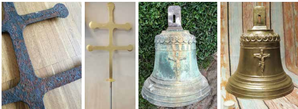
Renovovaný kříž a zvon kapličky.

nových dveří. Svým čistým, zařívě bílým nátěrem se stala kaplička nepřehlédnutelnou dominantou obce.