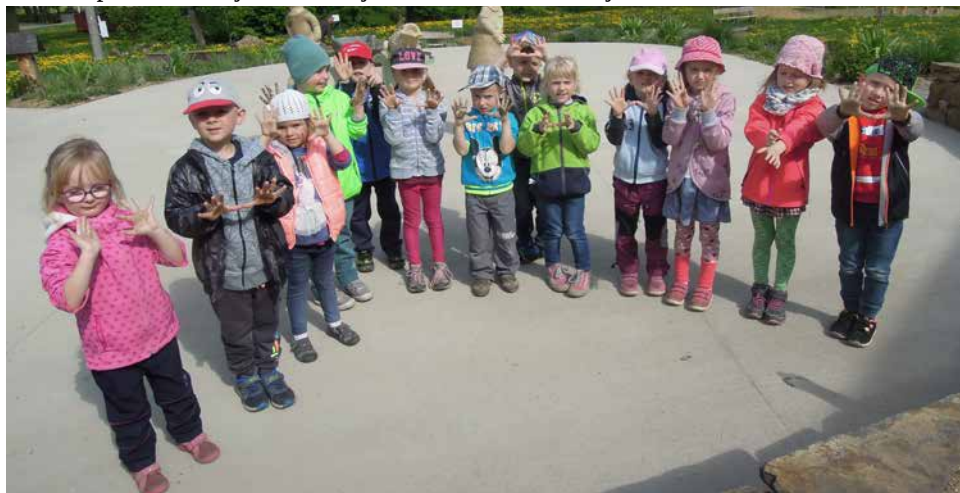
Děti ze třídy Včelíček na výletě v Balinách.

Prázdniny se blíží a děti mají za sebou další školní rok. Některé se chystají po prázdninách do prvních tříd, jiné zůstávají ve školce a budou si ještě užívat bezstarostné dětství.