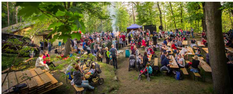
Čarodějnice na Letné.