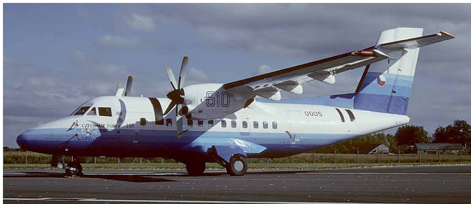
Prototyp letadla L 610 na Kunovickém letišti.

Úkolem pomocné energetické jednotky je kromě dodávky stlačeného vzduchu pro nastartování hlavního motoru také nouzové zabezpečení funkcí elektrických a hydraulických okruhů v letounu. Její vývoj si vyžádalo zavedení sériové výroby letadel L-39 v podniku