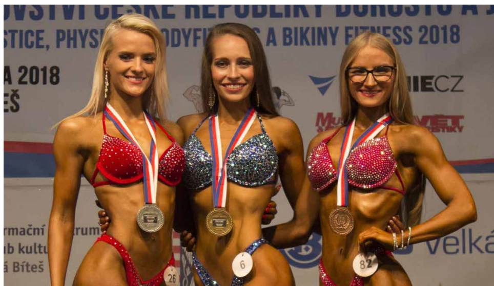
Vítězky v kategorii „Bikiny fitness juniorek do 164 cm“.

V sobotu 19. května poprvé v historii hostila Velká Bíteš Mistrovství České republiky dorostu a juniorů v kulturistice a fitness. 136 závodníků, kteří prošli sítím mistrovství Čech i Moravy, se utkalo v klasické a váhové kulturistice, physique, bodyfitness a bikiny fitness. Celá akce byla živě přenášena na internetovém portálu a zhlédlo ji přes 3600 diváků. Návštěvníci, kteří se na tuto akci přišli podívat, a bylo jich na šest stovek, měli možnost zhlédnout nejenom vypracovaná svalnatá těla mladých mužů, ale i krásné a půvabné mladé sportovkyně. Osmnáct sad pohárů a medailí, na kterých se podílelo sponzorsky i Město Velká Bíteš a První brněnská strojárna a.s., Velká Bíteš, bylo rozvezeno díky soutěžícím do všech koutů České republiky. Informační centrum a Klub kultury se omlouvá všem občanům, kteří se o akci nedozvěděli, za malou propagaci, ale s pořadateli se celá akce řešila na poslední chvíli a například plakáty jsme obdrželi až v podvečer závodu. Pokud pořadatelé budou mít zájem v příštím roce uspořádat obdobný podnik v našem městě, už dnes slibujeme, že se občané včas dozvědí termíny a přesný program.