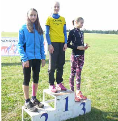
Přespolní běh.

Střední odborná škola Jana Tiraye Velká Bíteš se rozhodla k účasti na projektu Erasmus+. Jedná se o vzdělávací program, který je realizován prostřednictvím Evropské komise