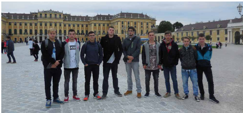
Ze zámku Schönbrunn.

a Národní agentury (pro ČR je to Dům zahraniční spolupráce) a financován Evropskou unií. Podporuje spolupráci a mobilitu ve všech oblastech vzdělávání: mládeže, neformálního vzdělávání, v odborné přípravě a sportu. ETEN Network, síť spojující několik zemí Evropy a podílející se na organizování odborných praxí, stáží a seminářů pro žáky středních škol a jejich pedagogy, vznikla v roce 2012 (v ČR v roce 2014). Cílem programu Erasmus+ je zlepšit odborné činnosti, jazykové znalosti v AJ a NJ, odstranit bariéry při komunikaci v neznámém prostředí a také umožnit žákům poznat odlišnou kulturu a pracovní život v dané zemi. V neposlední řadě přispívá k rozvoji osobních kompetencí (samostatnosti, sebevědomí atd.).