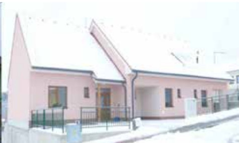
Odlehčovací služba při chráněném bydlení v Náměšti nad Oslavou