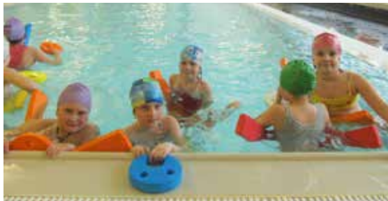
Na plaveckém výcviku v Kuřimi.

Stejně jako předchozí roky, i letos se pokračuje v plaveckém výcviku žáků třetích tříd. Ti jsou rozděleni podle plaveckých schopností do několika skupin. Během deseti lekcí, jež absolvují v Kuřimi, se seznamují s technikou základních plaveckých stylů pod dohledem zkušených plaveckých instruktorek. Na závěr výcviku potom prokáží, že zvládnou