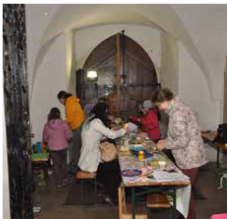
Zázemí pro děti.

delním představení a prohlídce kostela následovala slavnostní bohoslužba. Při mši se kostel výrazně zaplnil i návštěvníky, kteří do kostela běžně nechodí. Zazněly při ní písně Jana Badala – bítešského faráře a hudebního skladatele.