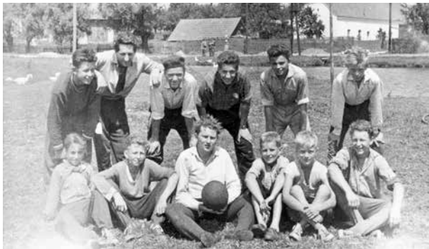
Místní fotbalisté z konce padesátých let (min. století).