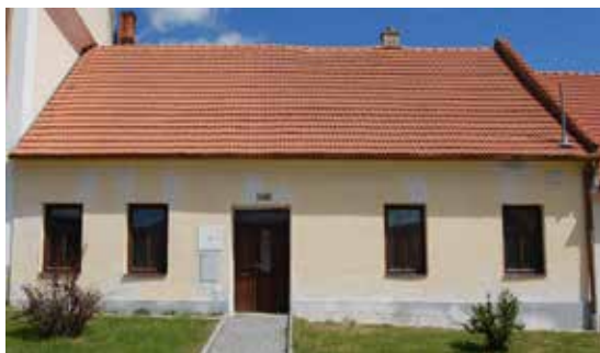
Dům čp. 196 v současnosti.

Parcela, na které dům stojí, bývala po staletí zahradou u sousedního domu čp. 117 (kdysi poplužního dvora, nyní sídla Základní umělecké školy), náležející od roku 1715 městu. Teprve 16. února 1819 obec prodala „pusté“ místo vedle školy se zahrádkou, změřenou na 134 2/6 čtverečních sáhů, k vystavění domu za 300 zlatých Františku Kočentovi . Ten prodal