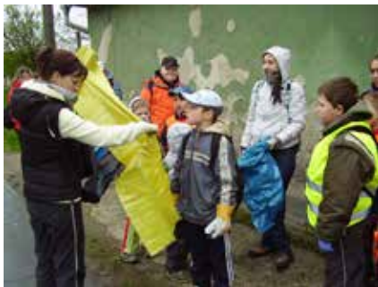
Při akci „Čistá Vysočina“.

„Chtějme mít čisto všude, nejen na místech, která vlastníme!!!“