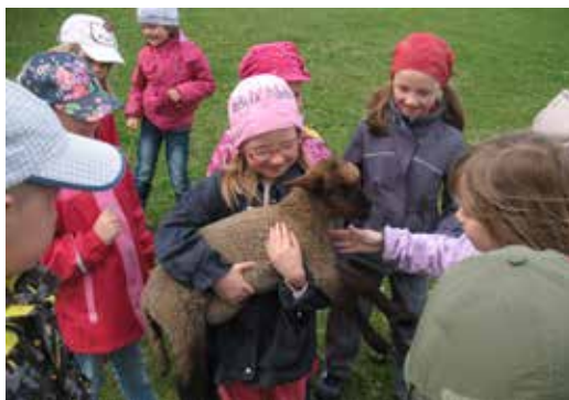
Děti na louce v Zašovicích.

Výlet jsme naplánovali záměrně až na jaro, protože jsme chtěli vidět narozená mláďátka, což se nám částečně podařilo. Ovečky už svoje jehňátka provázely po pastvinách, ale kravička se nějak „zdržela“, tak telátko jsme neviděli. Ale provázela nás zvědavá koza, pozdravili jsme mladého býčka, kroupnaté slepice se předváděly jako na výstavě. Krásné prostředí Vysočiny celou idylku v prostředí zelených kopců jen dotvořilo.