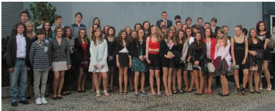
Návštěva v brněnském divadle.