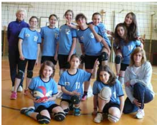
Volejbalové družstvo dívek.