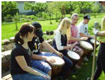
Hraní na africké bubny djembe.