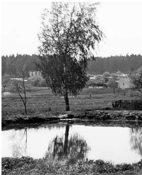
Dnes již zavezená Chybova luža (v pozadí jsou zásobníky směsi bývalé drůbežárny).

a společenský život obce “, uvádí se v zápise.