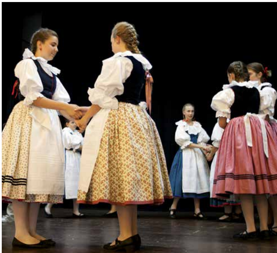
Snínek z loňské přehlídky