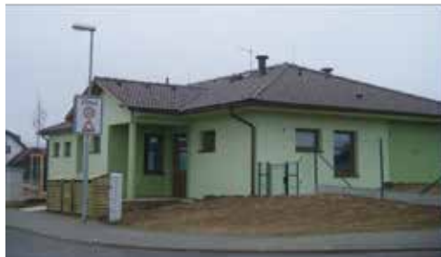
Odlehčovací služba při domově pro osoby se zdravotním postižením ve Velké Bíteši.

Odlehčovací služba je podpora pro lidi, kteří pečují o své blízké s mentálním nebo kombinovaným postižením. Co to znamená? Pokud někdo pečuje o svého blízkého doma a potřebuje si odpočinout, musí na operaci do nemocnice nebo rekonstruovat dům atd., může se obrátit na nás a svého blízkého ubytovat až po dobu tří měsíců. Tuto službu poskytujeme v nových domácnostech – při Chráněném bydlení U Železničního mostu č. 1038 v Náměšti nad Oslavou a při Domově pro osoby se zdravotním postižením Na Výsluní č. 678 ve Velké Bíteši. V těchto dvou domácnostech je vždy připraven moderně vybavený jednolůžkový pokoj s vlastním sociálním zařízením. Najdete zde rodinné a bezbariérové prostředí.