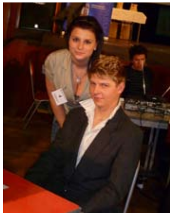
Pánský účes ve stylu Davida Beckhama.

Poděkování patří svatebnímu salonu v Košíkově - paní Jindře Rybníčkové, kde sponzorka akce zapůjčila svatební šaty pro model ledové královny.