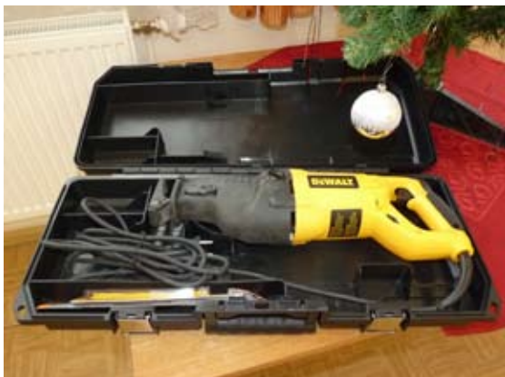
Elektrická mečová pila.

i kovu. U hasičských sborů se používá pro záchranné a vyprošťovací práce, zejména pro řezání předních sloupků karoserie havarovaného vozidla; řezání předního lepeného skla vozidel; přeřezání volantu (včetně jeho výztuhové obruče); prořezávání otvorů do střechy vozidel (včetně příčných ocelových výztuh); prořezávání otvorů do zaklíněných kapot a dveří vozidel; přeřezávání armatur a jiných konstrukcí při zásazích v průmyslu a stavebnictví; prořezávání otvorů do konstrukcí střech; prořezávání otvorů do zaklíněných dveří apod. Děkujeme.