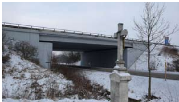
Dálniční most přes jindřichovskou silnici.

V polovině května byla zahájena montáž dálničního mostu nad budoucím novým úsekem silnice z Jindřichova do V. Bíteše. Dne 24. května byl přerušen provoz na „staré“ silnici a byla zahájena výstavba silnice nové. Pro objížďku byly vybudovány dva krátké úseky provizorní silnice z panelů a již dne 16. srpna byl dán nový úsek do provozu. Stará silnice byla definitivně zrušena a postupně zavezena.