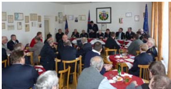
Pohled do zasedací místnosti.

Jejich činnost má ještě jeden neopomenutelný rozměr: nahlédneme-li do starých kronik, dovíme se, že již od začátku své více jak stoleté existence byli také strůjci společenského života na vesnicích i malých městech. Hráli divadla, organizovali plesy a taneční zábavy, jako čestná stafáž vyprovázeli spoluobčany na jejich poslední cestě. Mnoho z těchto aktivit