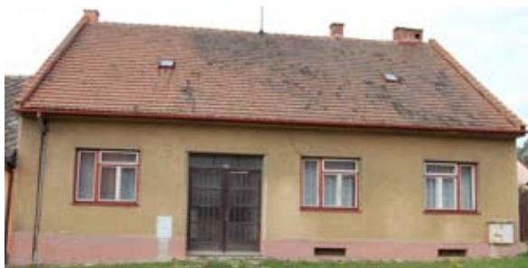
Dům č.p. 94 v současnosti.

Seriál o domech a jejich majitelích na náměstí, v ulicích i na předměstích Velké Bíteše zabývající se dobou před rokem 1871. Nyní HRNČÍŘSKÁ ULICE, DŮM ČP. 94: