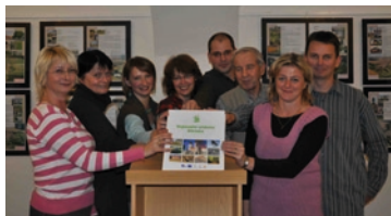
Společné foto autorů publikace.

V úterý 8. listopadu 2011 proběhla v Městském muzeu ve Velké Bíteši beseda s autory Regionální učebnice Bítešsko. Představení regionální učebnice, která vyšla v omezeném nákladu pouze pro účely výuky, bylo doplněno o výstavu „Poznejte svůj region“.