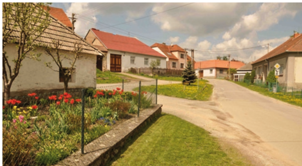
Náves v Holubí Zhoří se školou – pohled západním směrem