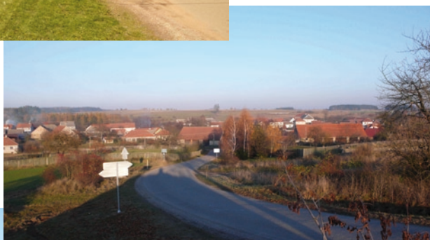
Pohled na vesnici od křižovatky Tasov, Čikov