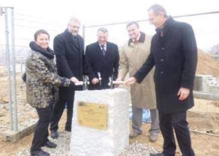
Poklepání základního kamene ve Velké Bíteši.

Proto ještě jednou děkujeme všem, kteří nám k tomuto snu dopomohli!!!