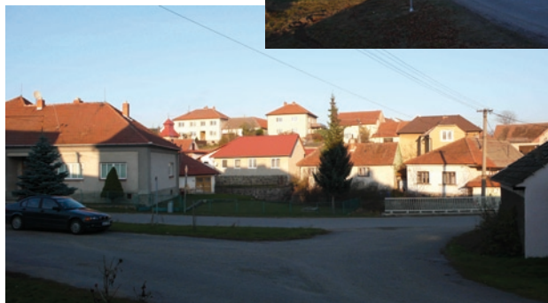
Pohled na náves severním směrem (v popředí škola a nový most)