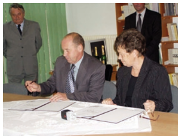
Podpis smlouvy o partnerství mezi ZŠ Velká Bíteš a ZŠ Tajovského Senec.

Lesy města Velké Bíteše poskytují mj. materiál pro výzdobu školy v předvánočním čase.