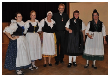
Foto zástupců Bítešanu20, žen z Jinošova, houslové muziky a města, folklorních sdružení z Německa.

působícího ve FoS jako zahraniční tajemník, se setkaly s vedoucími souborů Vysočan z Hlinska a Slováček z Brna. Zhlédly vystoupení souborů Groš v Dolní Rožince a žďárský soubor Kamínek, kde se rovněž zapojily do programu. V závěru týdne, dne 14. října, navštívily také Velkou Bíteš, kde se v kulturním domě uskutečnilo jejich setkání se členy národopisného souboru Bítešan a jeho hosty.