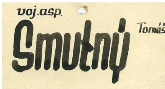
Milovice 15. 11. 1948, snato v den mého vyloučení 4. 3. 1949