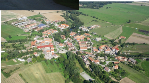
Letecký snímek vesnice