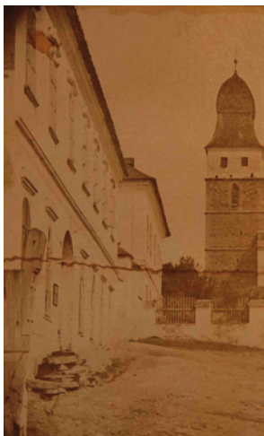
Patrový dům čp. 70 (vlevo) pod farou v roce 1874.