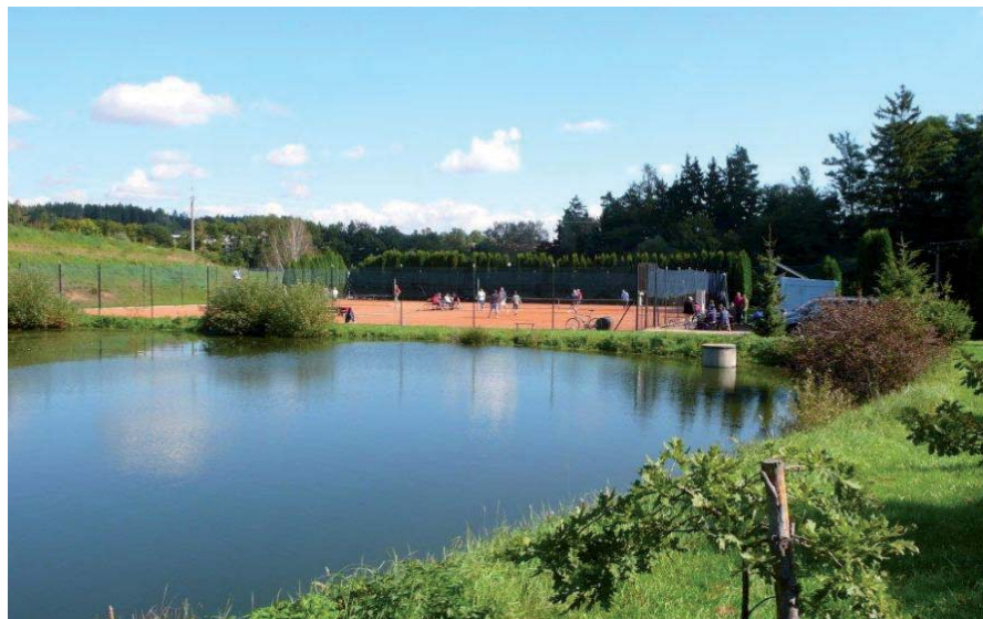
Sportovní areál v Nových Sadech.