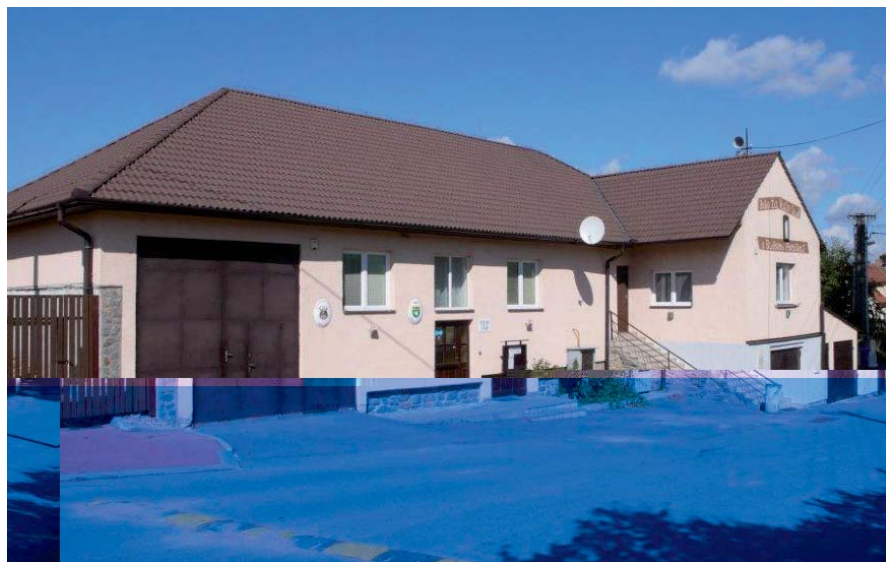
Budova obecního úřadu a hasičské zbrojnice.