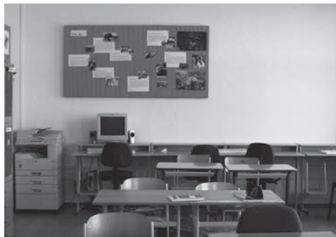
Renovovaná třída.

Než usedli 1. září žáci do školních lavic, proběhly o prázdninách akce, které zvelebily školu nejen po stránce materiální vybavenosti či úprav, ale i po stránce pedagogické.