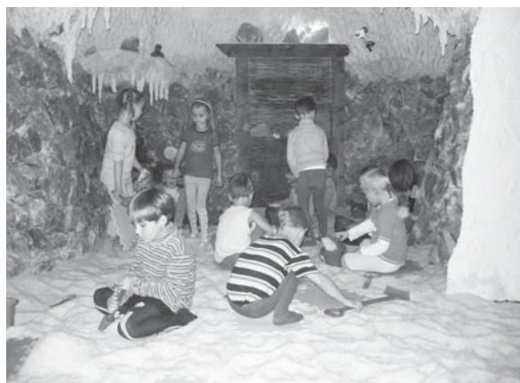
Solná jeskyně Velké Meziříčí 2009.

pové prvky, které jsou mimořádně důležité pro správnou funkci organismu. Pobyt v solné jeskyni je čistě přírodní metoda pro posílení zdraví, tzv. HALOTERAPIE - odvozeno od řeckého slova halos, což v překladu znamená sůl.