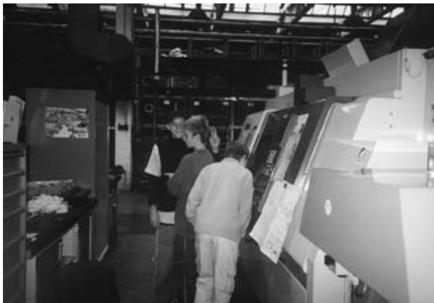
Exkurze v ITW Pronovia s. r. o.

Ráda bych se zastavila u projektu „ Jaká profese se mi líbí “, jehož cílem je reálné poznávání zvolené profese. Propracován je do té podoby, že účastníky mohou být nejen žáci 2. stupně základní školy, ale právě pro již zmiňovanou zábavnou formu i žáci 1. stupně ZŠ. Pochopitelně, že daný projekt se prolíná všemi vyučovacími předměty. Scénář je dílem vyučujících. Právě ony kladou důraz na rozpracování tématu a následně na mezipředmětové vztahy. Žáci se samostatně prokousávají k cíli dobře