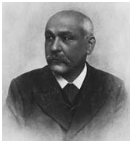
František Bartoš (1837 - 1906).

Při všech svých pedagogických povinnostech a vědecké práci účastnil se Bartoš pilně i společenského a kulturního dění v Brně. Byl zakládajícím členem Ústřední Matice školské, ředitelem a protektorem ústavu „Vesna“ a mimo jiné několik let redigoval Časopis Matice Moravské. Jeho vlastenectví bylo prosto všech okázalostí. S neobvyklou skromností a obětavostí pomáhal i hmotně všude tam, kde viděl, že je třeba pomoci. Poskytoval finanční dary českým kulturním institucím i nemajetným studentům.