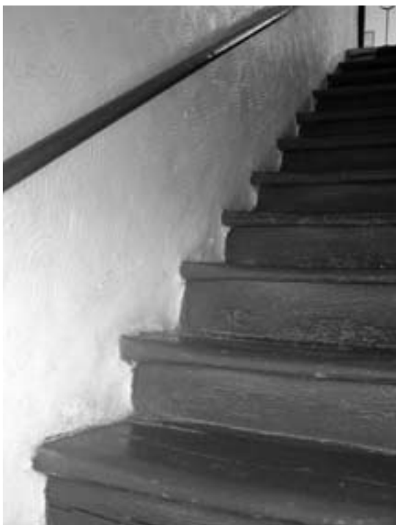
Historické schody v ZUŠ.

Až půjdete příště „do hudebky“ nebo jen okolo ní, pocítíte možná po přečtení tohoto článku závan dávných dob, kterými prošla dnešní Základní umělecká škola Velká Bíteš.