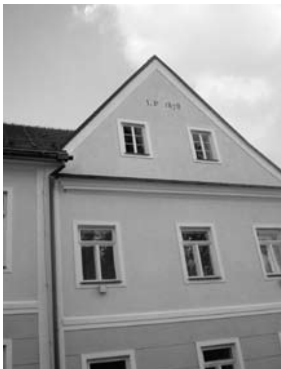
Štít budovy s letopočtem.