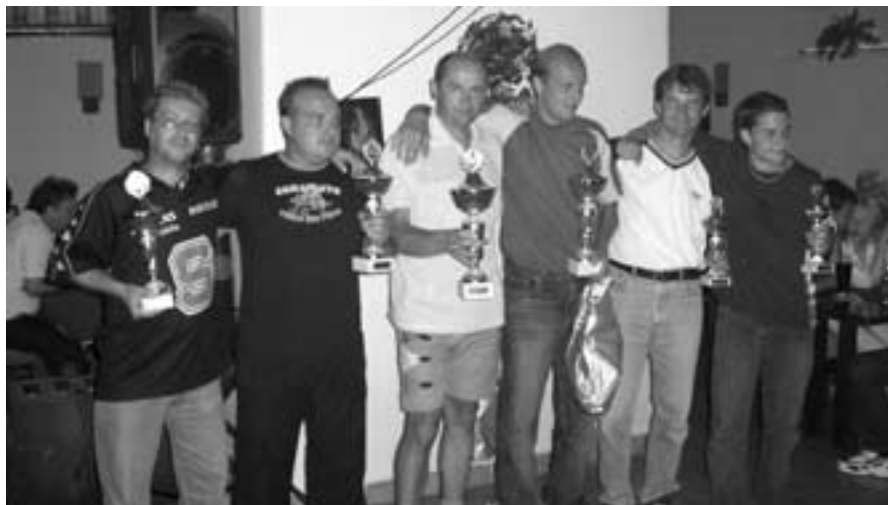
Vítězové loňského turnaje.