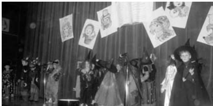
Vystoupení nejmenších dětí.