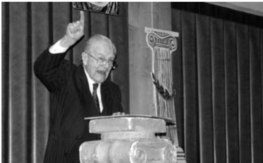
Pan profesor - hřímající...