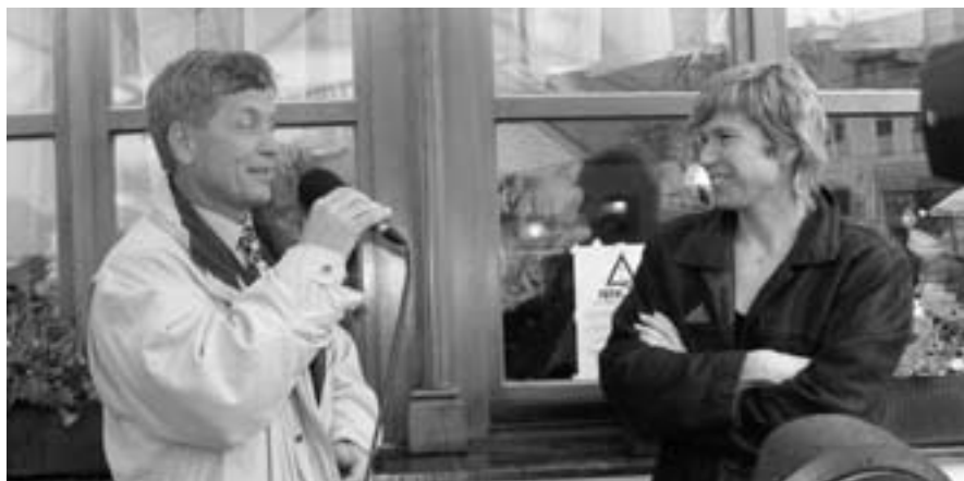
Katka Neumannová s Josefem Šmukařem.