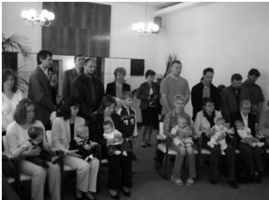
Pyšní rodičové a jejich malá štěstíčka.