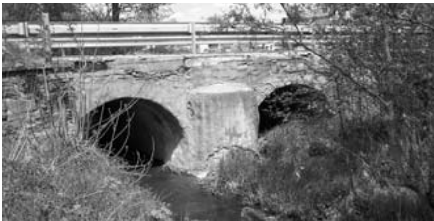
Současný stav mostu - 11. 5. 2006

Samotná stavba nového mostu bude zahájena realizací pilotů, což jsou vrty v průměru 1000 milimetrů a jdou do hloubky 10 metrů. V této hloubce se totiž nachází dobré únosné podlaží, které vychází z předchozích geologických prací a průzkumů. Celkový počet vrtů bude deset, přičemž po pěti v řadě na každé straně pod nosnými stěnami. Na vrty bude navazovat nosný monolitický železobetonový mostní rám ukončený asfaltobetonovou vozovkou.