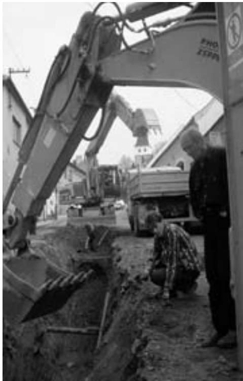
První dny rekonstrukce.

Ve čtvrtek 4. května proběhlo předání a převzetí staveniště pro stavbu „Jihlavského“ mostu pod evidenčním číslem 37-059, na silnici I/37. Veřejnou zakázku, kterou vypsal Ředitelství silnic a dálnic (ŘSD)ČR, Správa Jihlava, vyhrála stavební mostařská firma Firesta a.s., Brno. Realizace výstavby včetně všech dokončovacích prací by měla trvat do konce září, přičemž stavba vlastního mostu by měla být dokončena 30. srpna včetně ukončení uzavírky a zprovoznění mostu. Celkové náklady na realizaci dle smlouvy o dílo dosahují částky 17,5 milionu korun včetně daně z přidané hodnoty. Do konce září by měly být dokončené veškeré doprovodné práce a dobudování chybějícího chodníku s novým přechodem pro chodce z Lánic do ulice Pod Spravedlností.