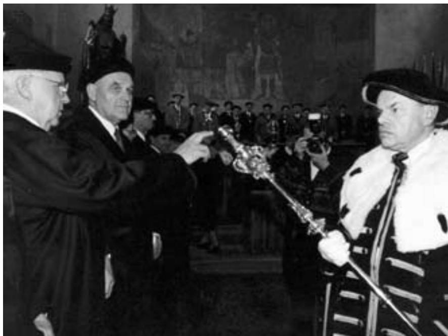
Karlova universita v roce 1998, 650 let po založení, „ Spondeo ac Polliceor “.

Táta od počátku, kdy se mu podařilo najít zaměstnání, posílal domů peníze celé rodině i známým, a to i přes velmi nízký příjem. Když jsem se po návratu do vlasti poprvé sešel se svou tetou, vyčetla mi: „ Měli jste posílat víc. “ Bratranec, člen Strany, mi napsal: „ Už jsme vám odpustili, že jste odešli. “ Táta s mámou si před válkou postavili v Brně v Králově Poli malý dvojdomek, kde jsem se jim také narodil. Po útěku propadl veškerý náš majetek státu. Podle zákonů přijatých po sametové revoluci však domek mohl být restituován. Dlouho jsem se o restituci pokoušel. Nikoli kvůli tomu, abych měl české koruny, ty nepotřebuji. O rodný dům jsem stál hlavně kvůli vzpomínce na rodiče. Po létech dlouhých tahanic s úřady mi paní soudkyně řekla: „ Podle zákona máte na tento majetek právo, restituce by ale poškodila dnešního českého obyvatele. “ Soud moji žádost zamítnul.