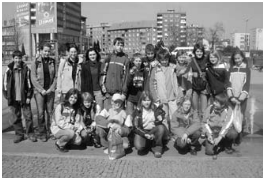
Účastníci soutěže Eurorébus.