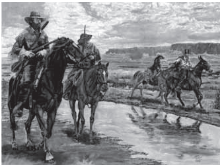
Ilustrace ke knize Karla Maye – Poklad na stříbrném jezeře.