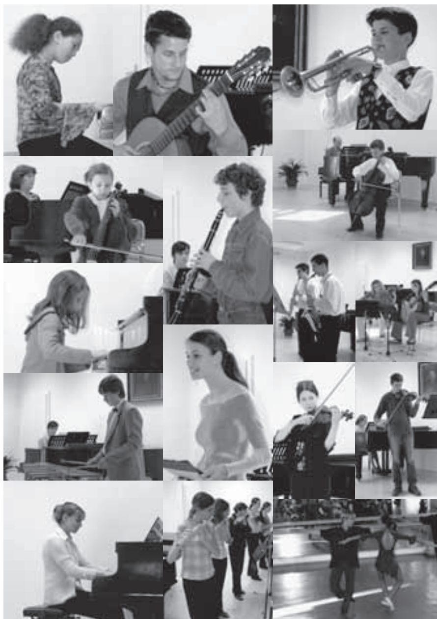
Momentky z koncertu.