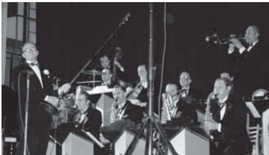
Ondřej Havelka a jeho Melody Makers.