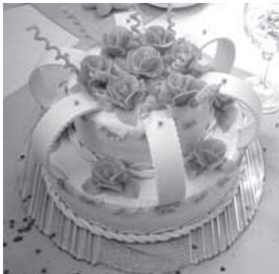
Ukázka závěrečné práce 3. ročníku v oboru cukrářka.