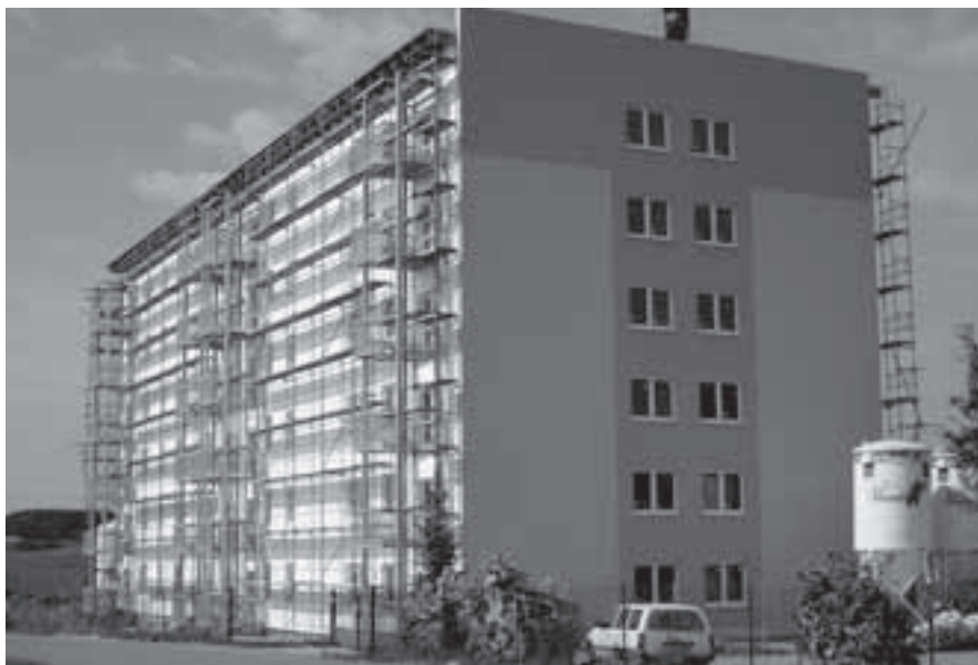
Pohled na dokončenou fasádu na severní části bytového domu.