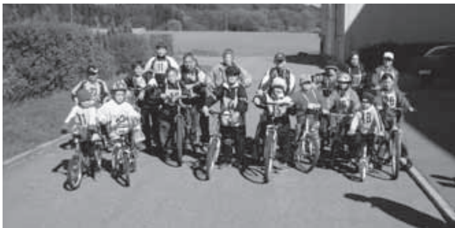
Účastníci závodu na kolech.