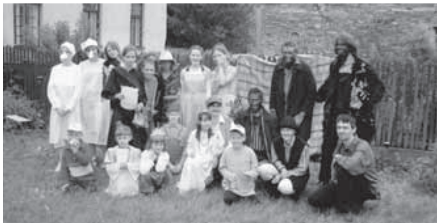
Pohádkové postavy, které vítaly děti na cestě za dobrodružstvím.