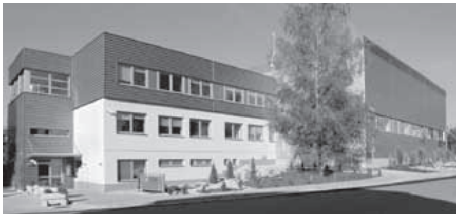
Areál společnosti AG FOODS a.s.