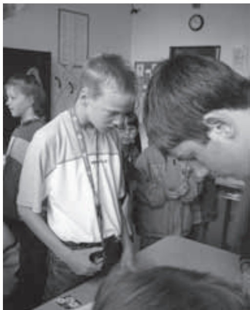
Žáci Speciálních škol při výuce.