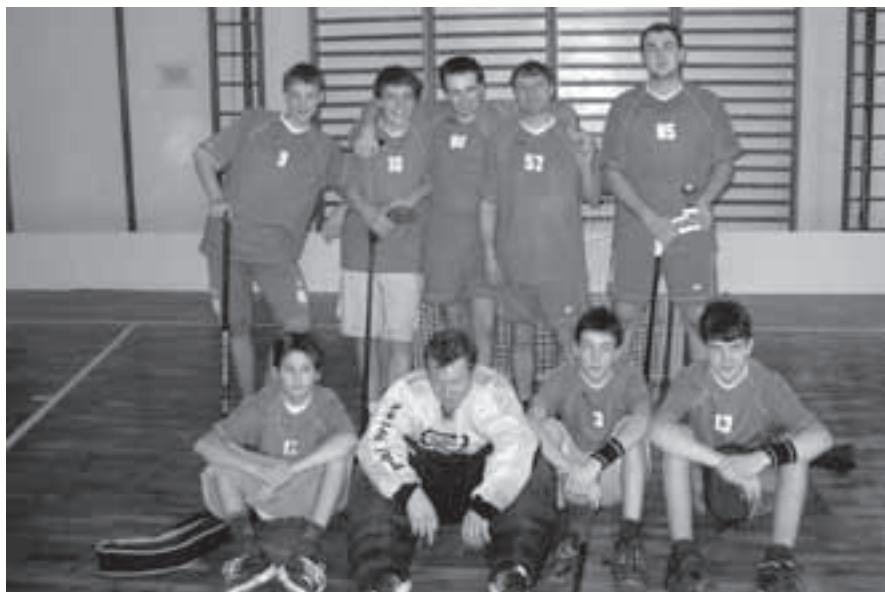
Tým Florbal Velká Bíteš - druhá část družstva.