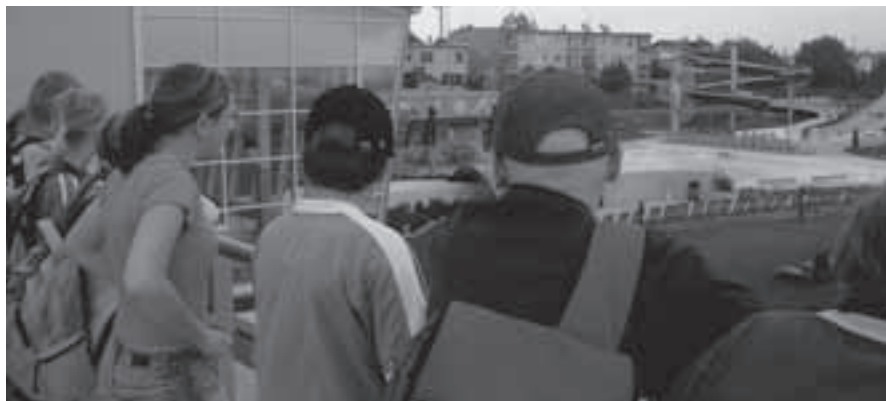
Žáci ZŠ Velká Bíteš na terase seneckého aquaparku.