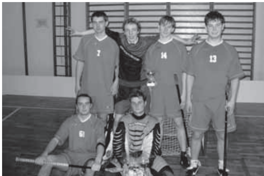
Tým Florbal Velká Bíteš - první část družstva.