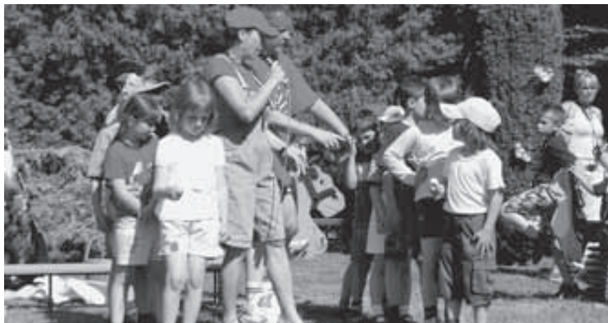
Děti na zahradní slavnosti.