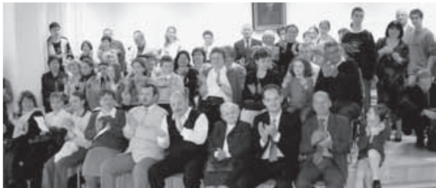
Návštěvníci koncertu na ZUŠ.