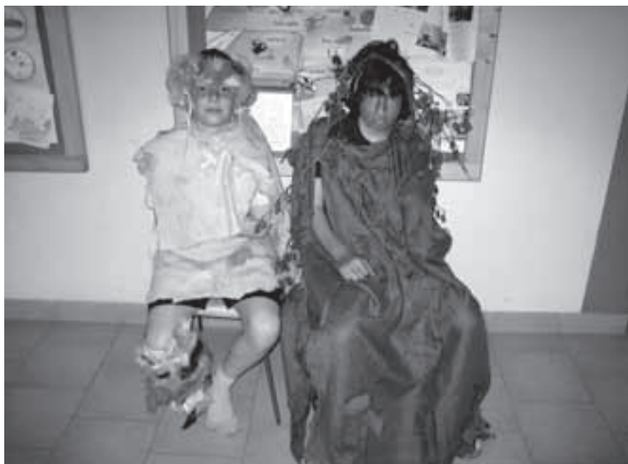
Lesní muž a hejkal z pohádkové říše.