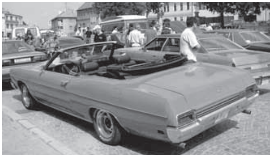
Pohled na vystavené exponáty.

Jak všichni víme, proběhl 4. června 2005 v našem městě I. Sraz amerických old-timerů. Počasí vyšlo a od časných ranních hodin se začali na spodní stranu náměstí