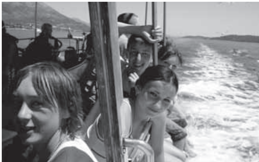
Při návratu z Korčuly nás doprovázeli rackové.