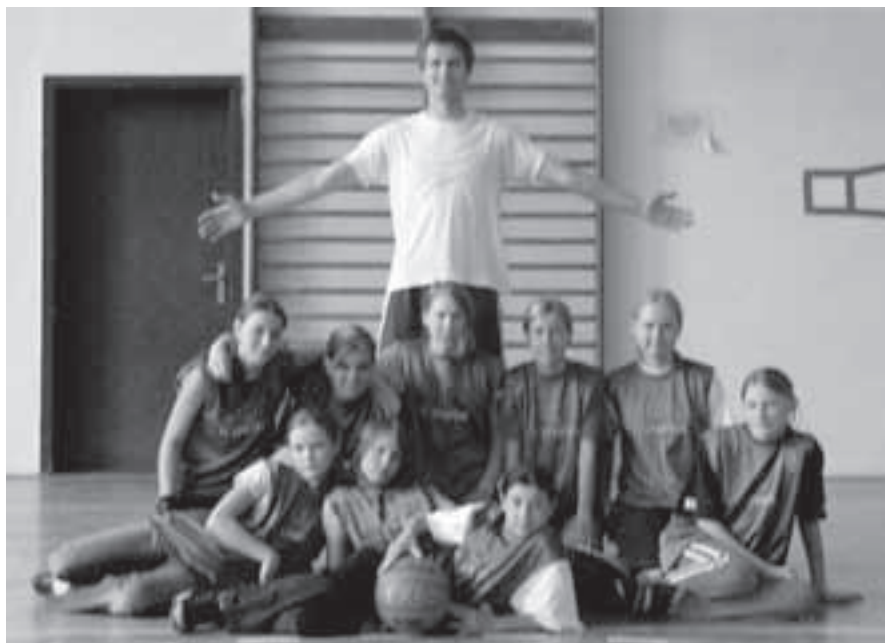
Sestava BO TJ Spartak Velká Bíteš „CUBS“ pro sezónu 2004/ 2005.

V příštím roce bude nutno hráčky přihlásit do soutěže mladších dorostenek, protože polovina týmu již nespĺňuje věkovou hranici pro starší žákyně. Ovšem neměl by to být žádný velký problém, pokud hráčky vydrží a tým se nerozpadne. Hlavním důvodem by mohl být odchod některých hráček na střední školy. Budu se snažit jako trenér mužstva udržet tým pohromadě a připravit ho co nejlépe na příští sezónu, abychom dosáhly alespoň takových výsledků jako v sezóně letošní a opět s nasazením reprezentovali Velkou Bíteš pod vysokými koši.