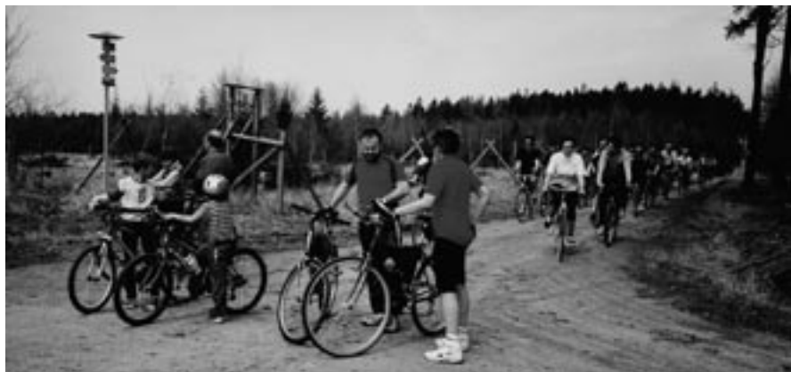
Na Klusácké aleji, cesta k Bělizně.

Začala doba výletů na kolech. Na poslední sobotu v květnu, 28. května 2005, pojedeme na celodenní výlet k pramenům potoka Libochovky. Libochovku od ústí do Loučky až do Kutín známe, projeli jsme ji několikrát. Projedeme a prozkoumáme zbývající část z Kutín až k jejímu prameni, který se pokusíme najít. Do Kutín pojedeme nejkratší cestou na Křížínkov, Nihov, Lubné a Kutiny, odtud již budeme pokračovat stále podél Libochovky: Žďárec, Meziboří, Dolní a Horní Libochová, Křížanov, Dobrá Voda, kde u kopce Chmelník (565m) zkusíme najít pramen Libochovky. Pokračovat budeme na Vídeň, přehradu Mostišťe a odtud podél Oslavy přes Velké Meziříčí, krásným Nesměřským údolím domů. Budeme-li mít roupy, zdoláme hrady Templštejn a Dub. Osvěžení a hodnocení bude v Tasově v cukrárně Jiřina. K výletům na kolech připomínáme a doporučujeme: nečekejte jen na naše organizované výlety. Oprašte