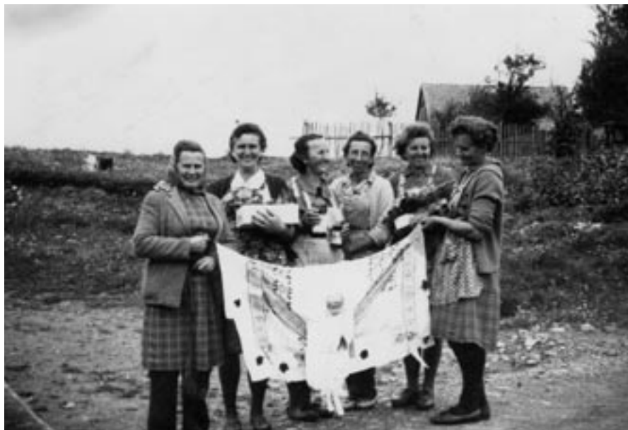
Bránařky v obci Hluboké.