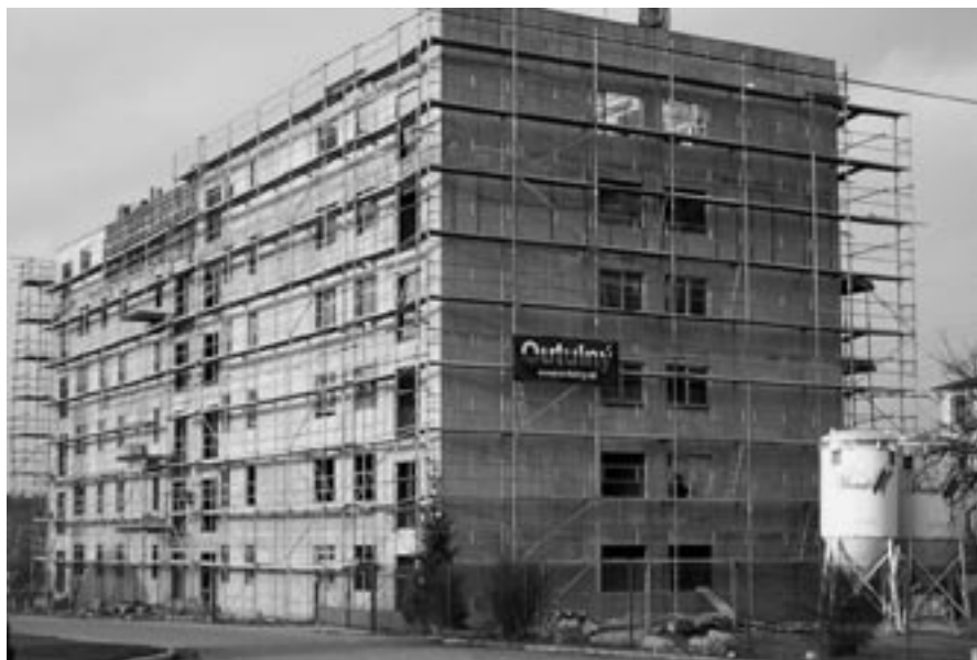
Pohled na dokončenou hrubou stavbu všech šesti nadzemních podlaží.

V případě zájmu o získání družstevního bytu v tomto bytovém domě se dostavte na Městský úřad získat podrobné informace a následně si vyberte konkrétní byt dle Vašich požadavků. Volné jsou ještě byty velikosti 2+1, 3+1 a 4+1.