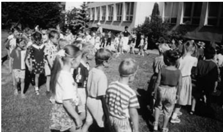
„Země květín a broučků“.