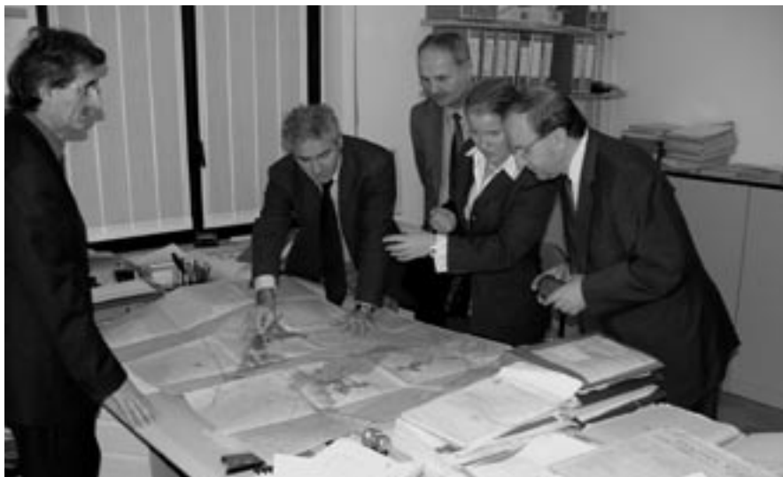
Zástupci partnerských měst nad územním plánem města Torrevecchia Pia.