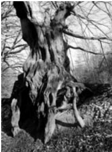
Pamětník císařských manévřů v roce 1909, z vladycké cesty z Jasenic do Jestřabí.