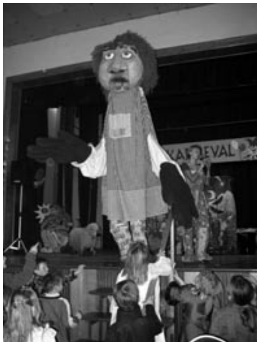
Karnevalový rej vrcholí.

Ten letošní karneval je už za námi, ale příští je tu coby dup! Těšíme se naviděnou.