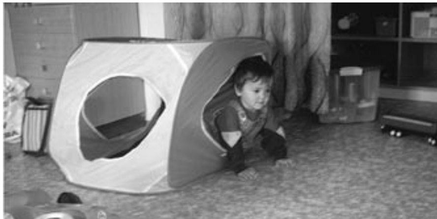
„A v budce je mi nejlépe...“