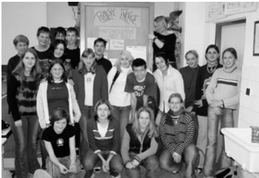
Účastníci projektu z 9. ročníků