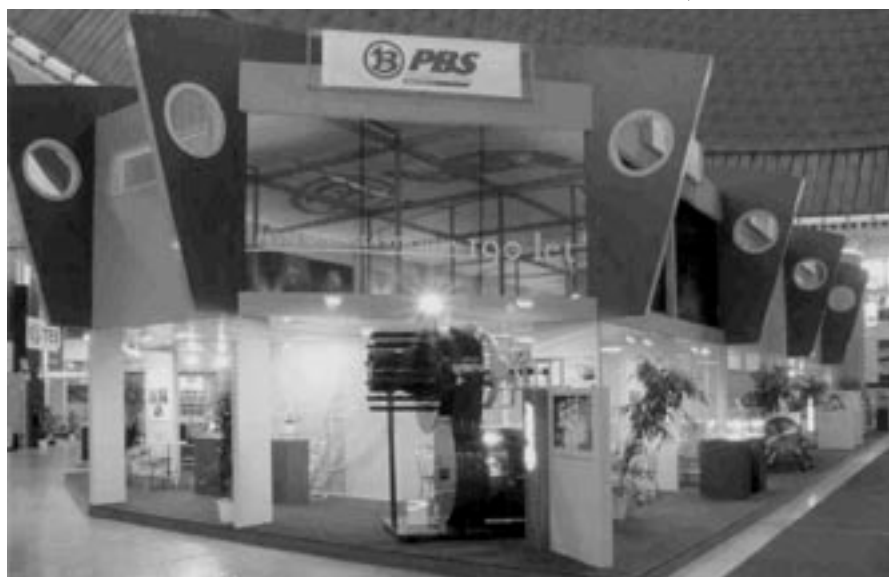
Expozice PBS z Mezinárodního strojírenského veletrhu Brno 2004