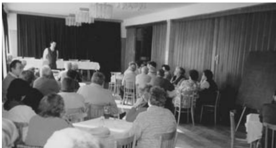
Na lednové Seniorkluby si pravidelně zveme mezi nás starostu města

Třetí středu v lednu, 19. ledna se v 15 hodin v kulturním domě opět setkáme na našem pravidelném Seniorklubu. Přesně před pěti lety to bylo také 19. ledna, co jsme měli náš první organizovaný programový Seniorklub, takže už po šedesáté prvé. Už tenkrát jsme si mezi nás pozvali starostu města a od té doby, každý rok v lednu, mezi nás chodil. Nejinak tomu bude i letos. Dozvíme se něco o dění v našem městě a pobe- sedujeme. Jinak naším hlavním, jako vždy, je naše klubové posezení s přáteli a poradit se o našich dalších akcích.