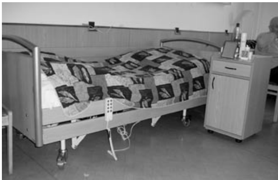
Nové automatické polohovací lůžko

V závěru loňského roku jsme mohli dokoupit do městského domova důchodců chybějící dvě automatická a dvě mechanická polohovací lůžka. Vzhledem k tomu, že město Velká Bíteš obdrželo dar na dovybavení DD od firmy MERO, a.s. Kralupy nad Vltavou ve výši 150 tisíc korun, mohlo vedení DD objednat i nové sedací soupravy na chodbu místo původních sedaček, které patří do čekáren v budově polikliniky.