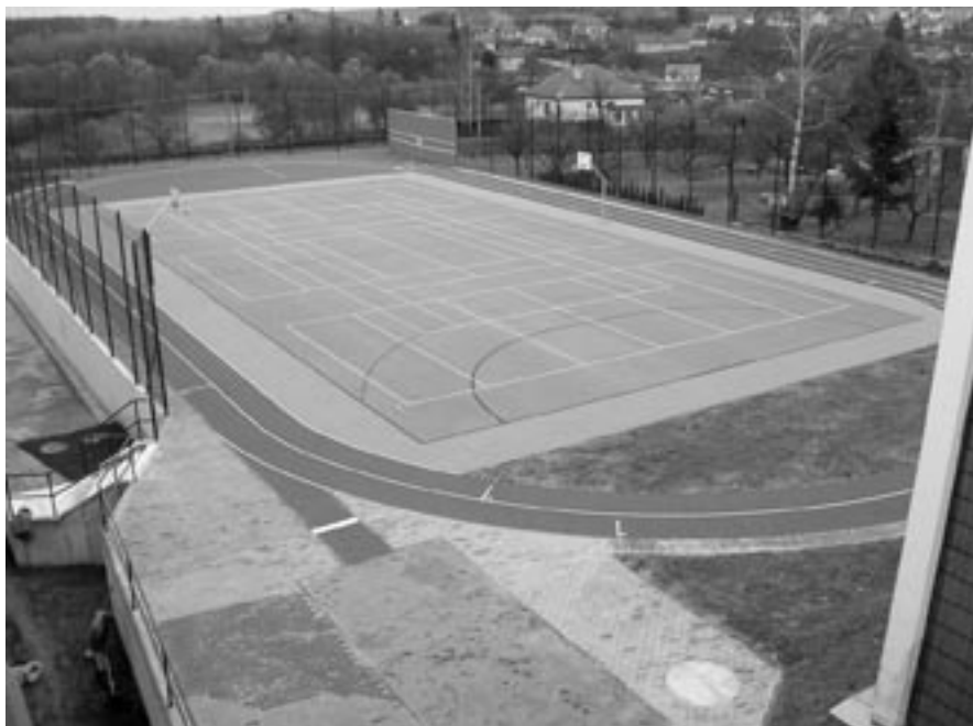
Pohled na nové sportoviště budovy školy od Severozápadu