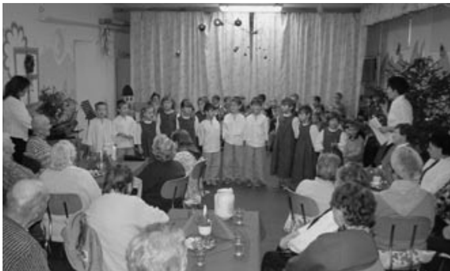
Milé setkání v MŠ