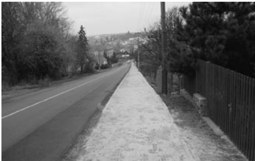
Při vjezdu do Velké Bíteše charakterizuje nový chodník podél komunikace technickou úroveň města