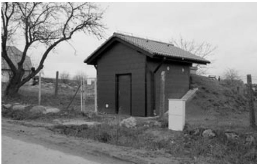
Pohled na dokončenou rekonstrukci vodojemu