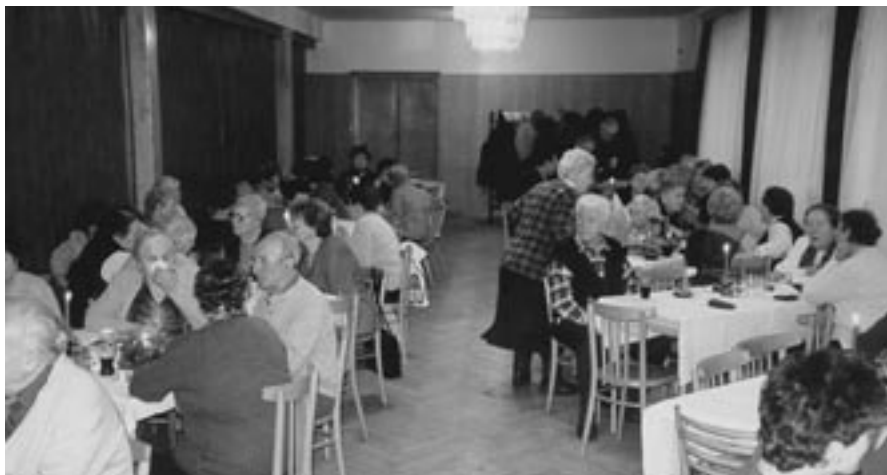
To jsme my, seniorky a senioři, v Seniorklubu