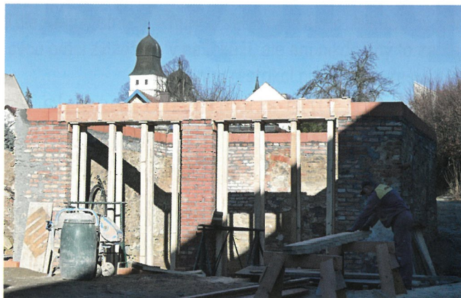
ZE STARÉ STODOLY NOVÁ VENKOVNÍ HERNA