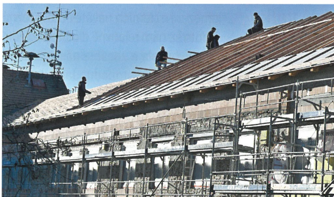
PRACOVNÍKŮM UŽ ZA KRK NEPOTEČE.

MV: V listopadu pokročily výrazně práce na střeše školky. Je důležité zakrýt stavbu, aby nevlhla deštěm a sněhem a abychom mohli dál pokračovat uvnitř budovy.