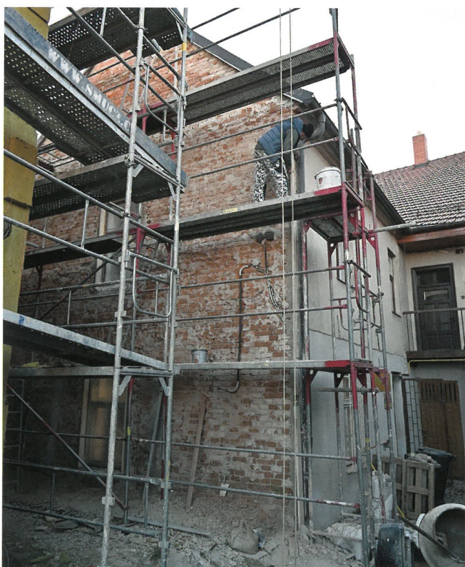
OPRAVUJE SE I FASÁDA SOUSEDNÍHO Č.P. 85 (KNIHOVNA)