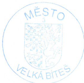
Otisk úředního razítka